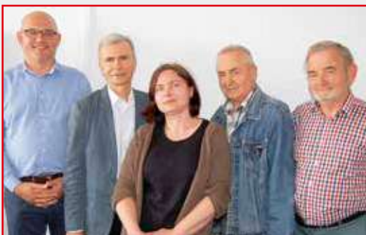
Okręgowa Komisja Rewizyjna