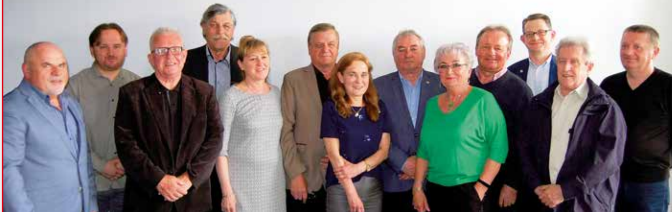
Okręgowy Sąd Dyscyplinarny LOIIB