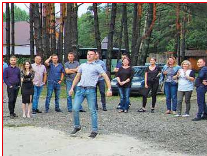
Uczestnicy spotkania w Górecku Kościelnym z chęcią brali udział w przygotowanych konkursach i kibicowali sobie wzajemnie. Konkurs rzutu kaloszem na odległość wywołał zarożumiałe zainteresowanie