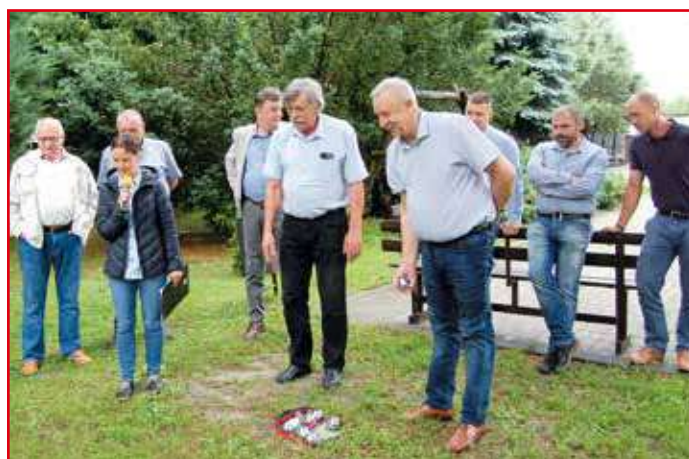
Konkurs gry w bule cieszył się wśród inżynierów w Natalinie dużym zainteresowaniem i mierzenie odległości budziło sporo emocji