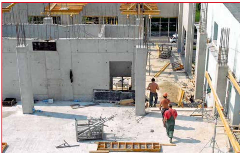
Przy uzgadnianiu projektu technologicznego obiektu użyteczności publicznej przedmiotem kontroli może być m.in. lokalizacja obiektu w aspekcie zgodności z obowiązującymi dokumentami planistycznymi, sanitarnymi przepisami prawnymi i dokumentami z zakresu ochrony środowiska

Przykładowo: wytyczne dotyczące podłączeń instalacyjnych niezbędnych do zamontowania wyposażenia technologicznego.