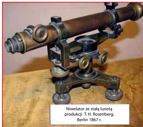
Niwelator ze stałą lunetą produkcji T. H. Rosenberg, Berlin 1867 r.

Do roku 1938 Lublin miał połączenia drogami bitymi z Warszawą, Radomiem, Zamościem, Chełmem i Raciborowicami. Warto zauważyć, że do wybuchu I wojny światowej wybudowano niewiele dróg, m.in. z Chełma do Krasnegostawu, z Janowa Lubelskiego do Biłgoraja i z Łęcznej do Włodawy, czy z Zamościa przez Tomaszów Lubelski do Lwowa. Niektóre miasta powiatowe nie miały połączeń z drogami bitymi, m.in. Hrubieszów.