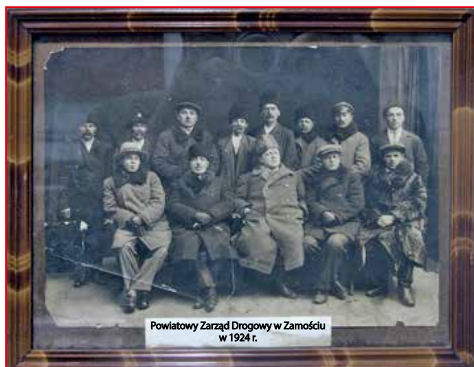
Powiatowy Zarząd Drogowy w Zamościu w 1924 r.