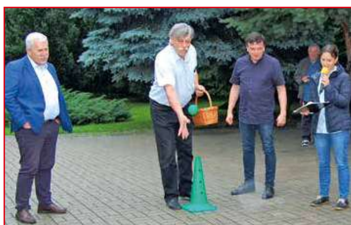
I kto rzuci celniej?

Pomimo kapryśnej pogody, która nie szczędziła deszczu, humory dopisywały i inżynierowie z okręgu chełmskiego z chęcią brali udział w przygotowanej części rekreacyjnej i konkursach. Nie brakowało chętnych do gry w bule, darta, czy też sprawdzenia umiejętności wędkarskich. Oczywiście, na najlepszych czekały nagrody!