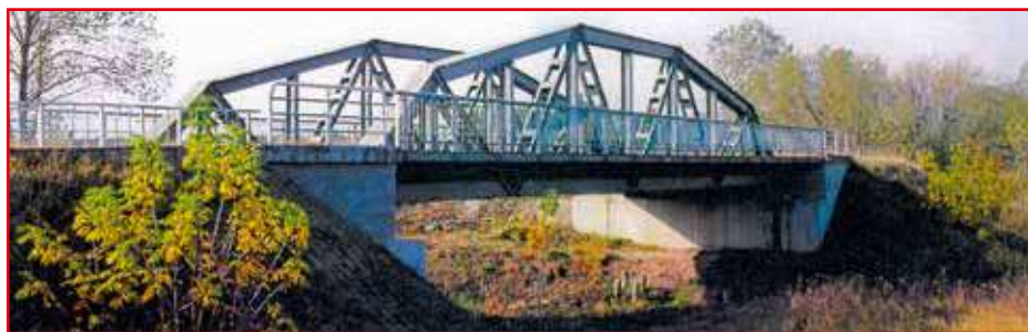
Most na Słudwi w Maurzycach po przeniesieniu jako „zabytek kultury narodowej”