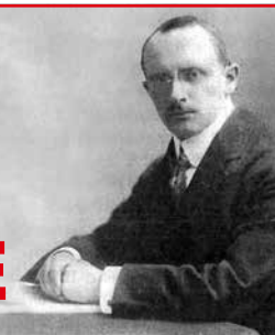
Stefan Bryła w 1920 r. jako młody naukowiec

Stefan Bryła był autorem pierwszego w świecie mostu spawanego, który stał się światową rewelacją, opisywaną w literaturze technicznej kilkudziesięciu państw, z Japonią włącznie. Był nie tylko wybitnym inżynierem, ale przede wszystkim niesamowitym człowiekiem. Dlatego też chciałbym, chociaż w skrócie, przedstawić jego sylwetkę.