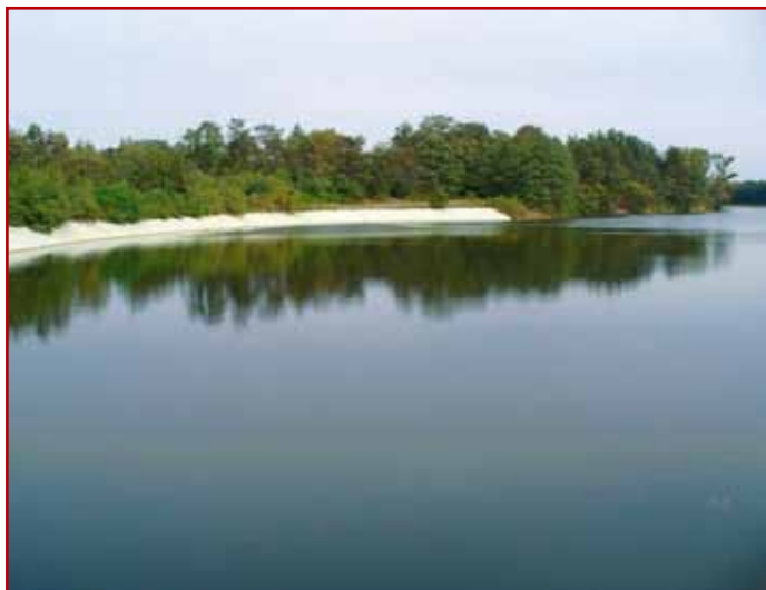
Zbiornik retencyjny Majdan Sopocki, gm. Susiec