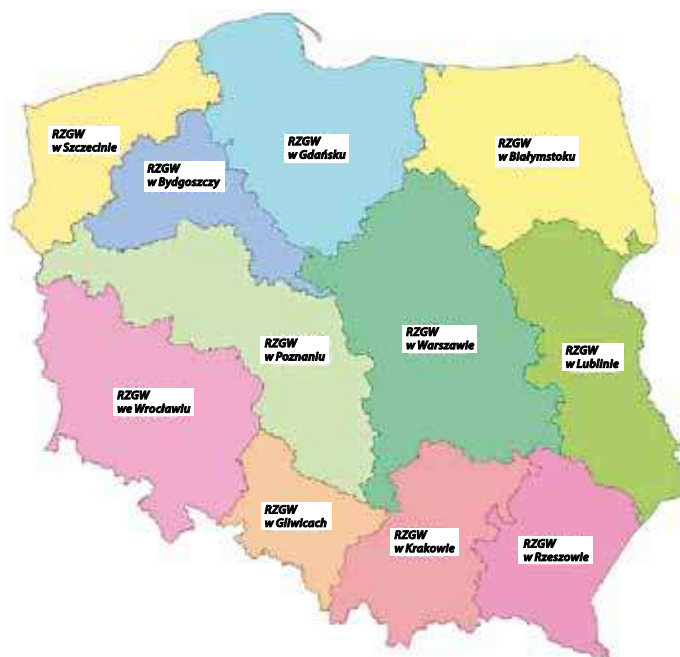
Siedziby Regionalnych Zarządów Gospodarki Wodnej

Rozszerzenie dotychczasowego zakresu opłat za korzystanie z wód to realizacja zapisanej w Ramowej Dyrektywie Wodnej zasady zwrotu kosztów usług wodnych. Środki te w wieloletniej