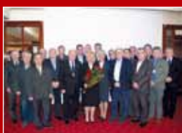
XVII Zjazd Sprawozdawczo- Wyborczy Lubelskiej OIIB