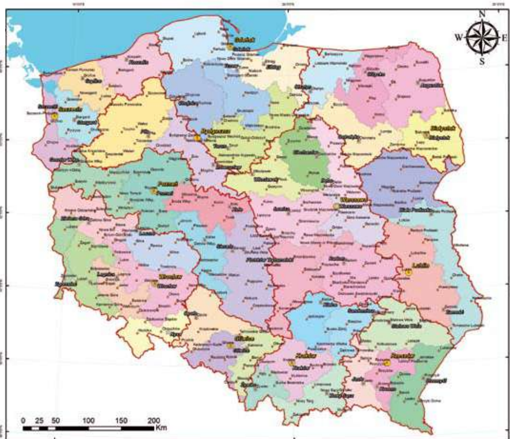
Legenda • Siedziba nadzoru wodnego • Siedziba RZGW ■ Siedziba zarządu zlewni □ Granica RZGW

Siedziby RZGW, Zarządów Zlewni i nadzorów wodnych