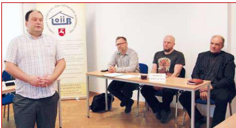
Zebranie wyborcze w Lublinie – 16.11.2017 r.

na każdym wyznaczonym zebraniu. W sumie wybrano 106 delegatów z wszystkich branż zawodowych funkcjonujących w samorządzie zawodowym inżynierów budownictwa. Nowo wybrani delegaci będą stanowić skład okręgowych zjazdów podczas V kadencji, przypadającej na lata 2018–2022. Wśród tej grupy 24 delegatów wybrano po raz pierwszy i stanowią oni 22,64% ogółu delegatów. Należy dodać, że 14,15% stanowią kobiety, co oznacza 15 pań, natomiast 91 panów stanowi 85,85% wszystkich delegatów. Frekwencja na zebraniach wahała się od kilku do kilkunastu procent. Największa była podczas zebrania obwodowego 3 listopada 2017 r. w Zamościu – 13,33%.