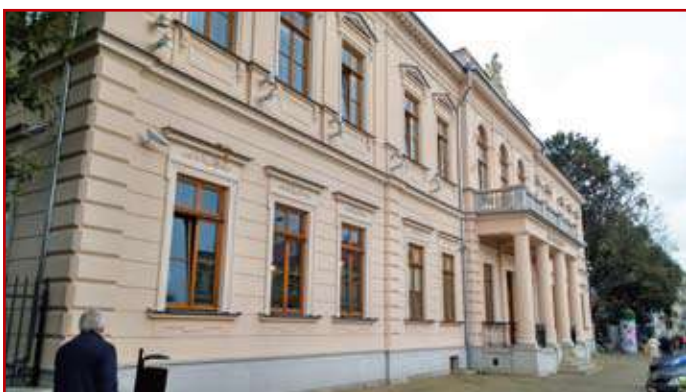
Sąd Okręgowy w Lublinie