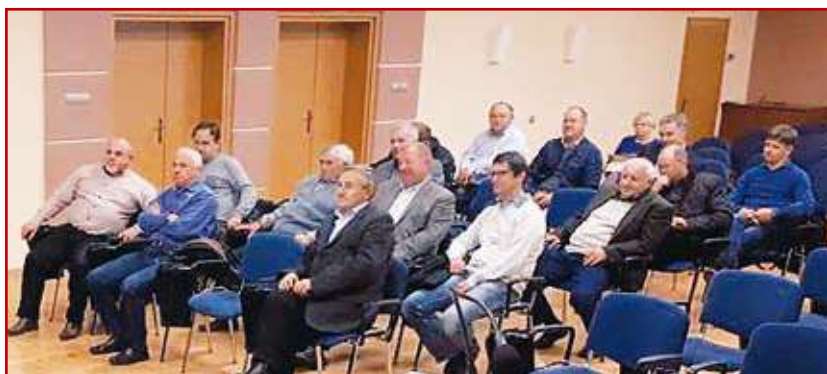
Zebranie obwodowe w Białej Podlaskiej – 3.11.2017 r.