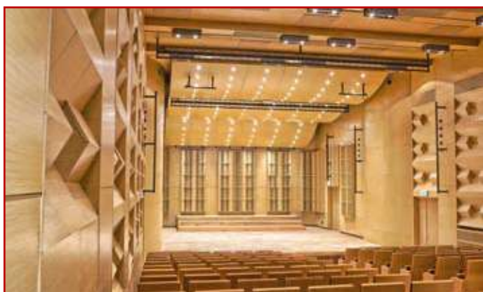
Sala koncertowa w Szkole Muzycznej I i II stopnia im. Tadeusza Szeligowskiego w Lublinie