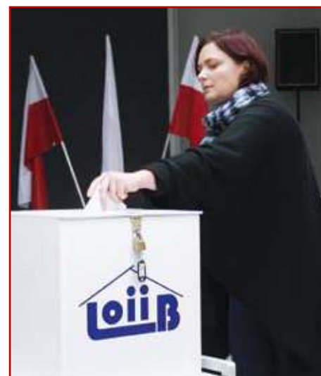
Wybieraliśmy delegatów w Zamościu.