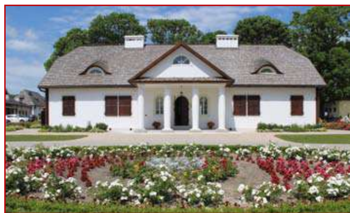
Starościński zespół dworsko-folwarczny wraz z historycznym parkiem w Krasnymstawie

– Reasumując wszystkie edycje konkursu stwierdzić należy, że ocenionych zostało w tym czasie około 130 inwestycji reprezentujących szeroko rozumiane budownictwo, poczynając od budynków mieszkalnych poprzez obiekty użyteczności publicznej po budowle inżynierskie. Przez 15 lat staramy się propagować kreatywność inwestorów, doskonałą organizację pracy, budowlany kunszt wykonawców oraz pasję tworzenia – zaznaczył podczas