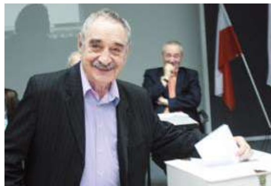
Zebranie wyborcze w Zamościu – 4.12.2017 r.