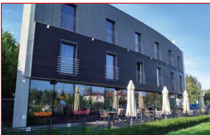
Hotel Willowa w Lublinie