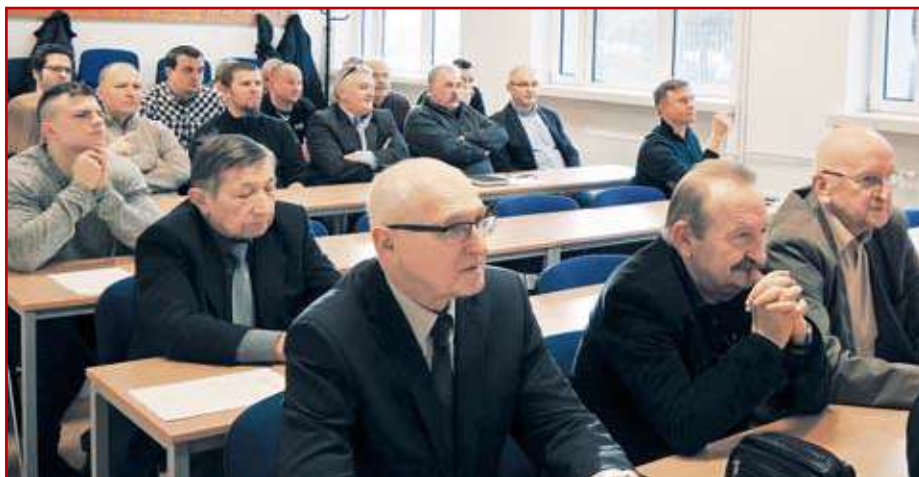
Sala lubelskich obrad – 4.12.2017 r.

na każdym wyznaczonym zebraniu. W sumie wybrano 106 delegatów z wszystkich branż zawodowych funkcjonujących w samorządzie zawodowym inżynierów budownictwa. Nowo wybrani delegaci będą stanowić skład okręgowych zjazdów podczas V kadencji, przypadającej na lata 2018–2022. Wśród tej grupy 24 delegatów wybrano po raz pierwszy i stanowią oni 22,64% ogółu delegatów. Należy dodać, że 14,15% stanowią kobiety, co oznacza 15 pań, natomiast 91 panów stanowi 85,85% wszystkich delegatów. Frekwencja na zebraniach wahała się od kilku do kilkunastu procent. Największa była podczas zebrania obwodowego 3 listopada 2017 r. w Zamościu – 13,33%.