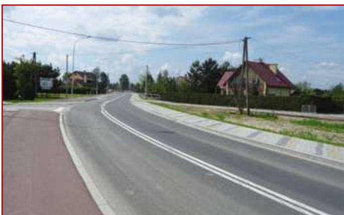
Al. Jana Pawła II w Rzeszowie