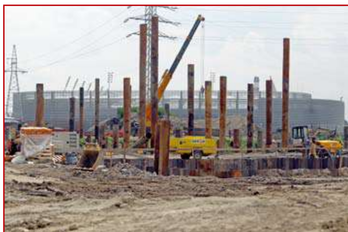
Ulica Muzyczna w przebudowie

3 – Budowa ulicy Muzycznej – przebiega od skrzyżowania z ulicami Narutowicza, Głębokiej i Nadbystrzyckiej (łącznie z tym skrzyżowaniem) do ul. Stadionowej, z mostem przez rzekę Bystrycę. Ulica ma być gotowa przed Mistrzostwami Europy U-21 w Piłce Nożnej 2017 r. Stanowić będzie dojazd do stadionu Arena Lublin, do Trasy Zielonej i dworca kolejowego oraz do przyszłe-