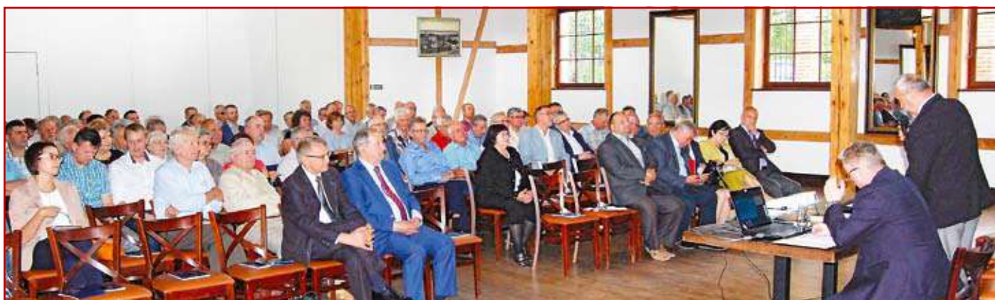
Uczestnicy spotkania w Puławach