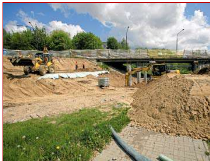
Prace w dzielnicy Czechów

Zakończenie budowy ulicy BMC nastąpi już po oddaniu do użytku Zachodniej Obwodnicy Lublina, węzła „Solidarności” oraz ulicy Muzycznej, a także wykonaniu remontów w/w ulic.