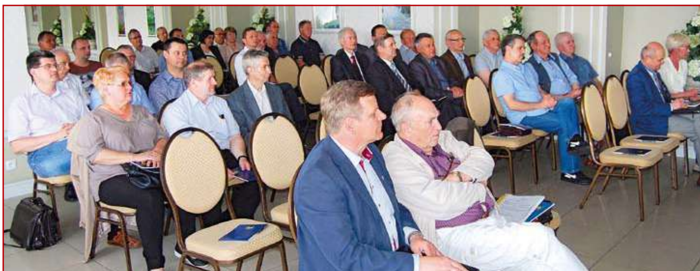
Uczestnicy spotkania w Janowie Lubelskim