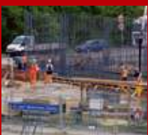
Przebudowa ul. gen. B. Ducha w Lublinie