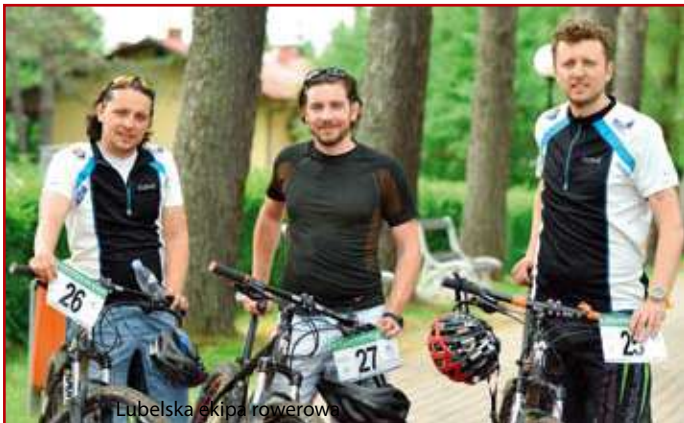
Lubelska ekipa rowerowa

W dniach 2–4 czerwca br. w Bieszczadach odbyły się I Ogólnopolskie Mistrzostwa Inżynierów Budownictwa w Rowerowej Jeździe na Orientację. Lubelska reprezentacja zajęła trzecie miejsce w klasyfikacji drużynowej.