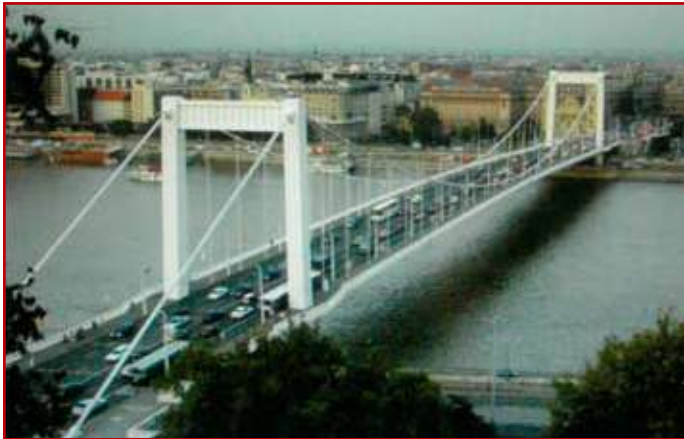
Most Elżbiety na Dunaju w Budapeszcie. Stan obecny.

Wybudowany most posiadał jezdnię o szerokości 11 m, początkowo wykładany był drewnianymi balami, z dwoma chodnikami o szerokości po 3,5 m i dwoma przystankami tramwajowymi zlokalizowanymi w pobliżu pylonów. Ruch tramwajowy uruchomiono jednak dopiero 14 sierpnia 1914 r., kiedy porozumiały się dwa towarzystwa tramwajowe w sporze o prawa do przewozu osób przez Dunaj. Tego mostu też nie oszczędziła II wojna światowa i został on wysadzony przez wycofujące się wojska niemieckie. Zniszczona została prawie całkowicie konstrukcja przęsła mostu, a ocalał jedynie na brzegu po stronie pesztańskiej pylon, stojący aż do roku 1960. Dopiero, kiedy nastąpił znaczny wzrost ruchu przystąpiono do budowy nowego mostu.