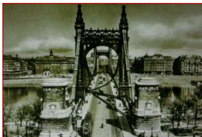
Most Elżbiety na Dunaju w Budapeszcie. Stan w roku 1914.