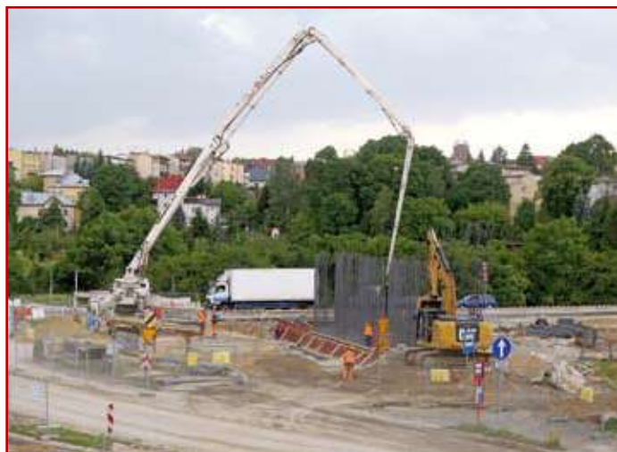
Przebudowa ul. B. Ducha

Węzeł ten jest obecnie w budowie i stwarza największe perturbacje w miejskim ruchu drogowym. Odcięte zostały dwie ulice, a na pozostałych ruch odbywa się z bardzo dużym ograniczeniem. Najlepszym rozwiązaniem dla kierowców jest teraz omijać to skrzyżowanie. Dlatego też, większość ruchu samochodowego przeniosła się na inne ulice po obu stronach alei Solidarności. Najbardziej odczuwalne jest to na ulicach: Willowej, Poligonowej/Bohaterów Września i Zelwerowicza, na których ruch się potroił. Po oddaniu do użytku Zachodniej Obwodnicy Lublina, zmniejszy się również ruch samochodowy w rejonie budowanego węzła „Solidarności”. Wyeliminowany zostanie także przejazd samochodów ciężarowych i części samochodów osobowych.