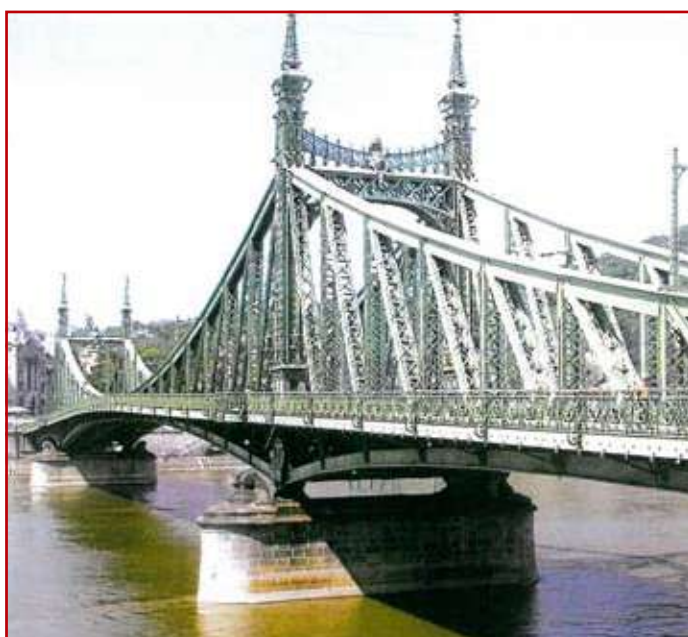
Most Wolności na Dunaju w Budapeszcie. Stan obecny.

Most Wolności, który powstał w latach 1894–1896 uważany za najładniejszy, jest jedynym mostem na Dunaju, który pomimo zniszczeń wojennych, został odbudowany w niezmienionej formie, o niezmiennych wymiarach i z ozdobami, zgodnymi z pierwotnym, co można podziwiać również dzisiaj.