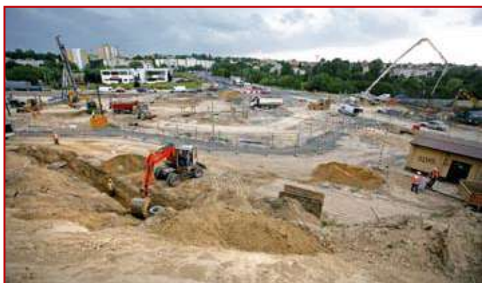
Prace prowadzone przy przebudowie ul. B. Ducha

2 – Węzeł „Solidarności” (nazwa robocza) na skrzyżowaniu alei Solidarności z aleją Sikorskiego i ulicą B. Ducha.