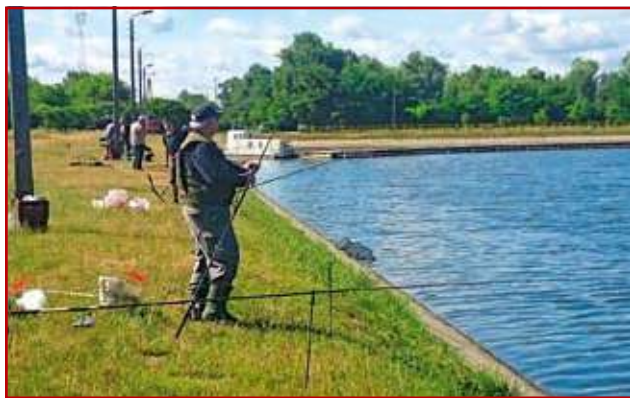
Wędkarze w akcji