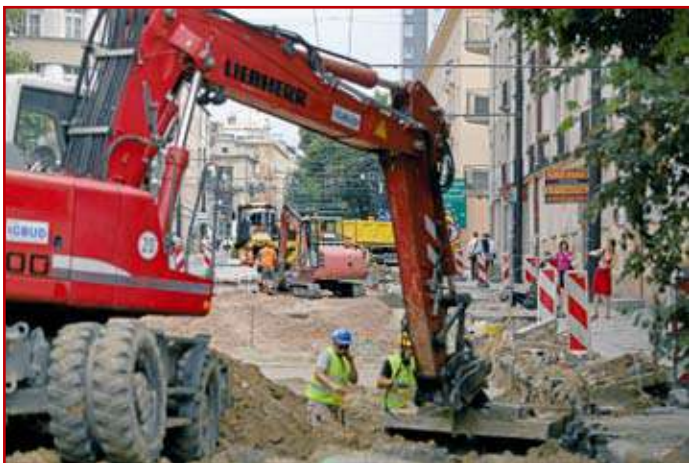
Zmieniana ul. Narutowicza

4 – Remont ul. Narutowicza na odcinku od al. Piłsudskiego do ul. Ochotniczej – odcinek o długości 0,4 km. Jest to ostatni z odcinków tej ulicy podlegający remontowi.