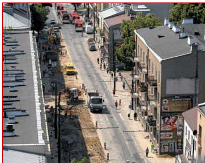
Przebudowa ul. Narutowicza. Widok z lotu ptaka

Ad. 9B – Na planowanym odcinku trasy – od ul. Kunickiego do ul. Wrotkowskiej – obecnie nie ma ciągu komunikacyjnego. Będzie to nowa, dwujezdniowa ulica. Jej budowa domknie małą obwodnicę od strony południowej miasta. Przy jej budowie pewne zakłócenia w ruchu występować będą lokalnie, a większe w rejonie skomunikowania jej z ul. Wrotkowską.