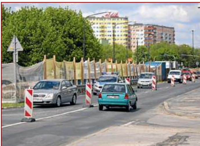
Remont w ciągu ul. Kompozytorów Polskich

Remonty istniejących wiaduktów na ulicach Lublina (poprzednie i obecne), ze względu na zły stan techniczny ich konstrukcji nośnej, polegają praktycznie na ich odbudowie. Ulica Kompozytorów Polskich jest dwujezdniowa, z dwoma wiaduktami i stanowi