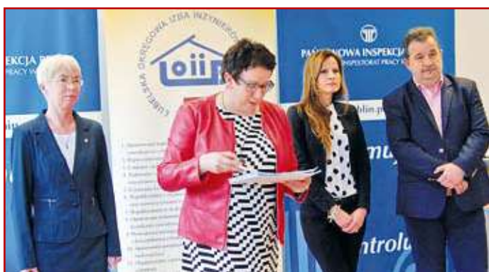
Przedstawiciele organizatorów konkursu

Pierwszy etap konkursu odbył się na terenie placówek edukacyjnych, biorących w nim udział, które spośród swoich uczniów wyłoniły dwie osoby do etapu wojewódzkiego. W roku bieżącym, do rywalizacji na szczeblu międzyszkolnym przystąpiło 30 uczniów z 15 szkół o profilu budowlanym z całego województwa lubelskiego. Konkurs wojewódzki składał się z części teoretycznej, w której uczestnik odpowiadał na 30 pytań testowych oraz z części praktycznej, polegającej na wykonaniu jednego losowo wybranego zadania z zakresu budownictwa.