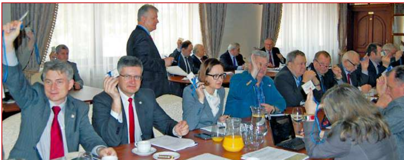
Głosowanie i liczenie głosów w czasie zjazdu

oraz przedstawicielami administracji rządowej i lokalnej. W bieżącym roku planowane jest zorganizowanie kolejnych takich spotkań, m.in. w Puławach, Hrubieszowie, Janowie Lub. i Parczewie.