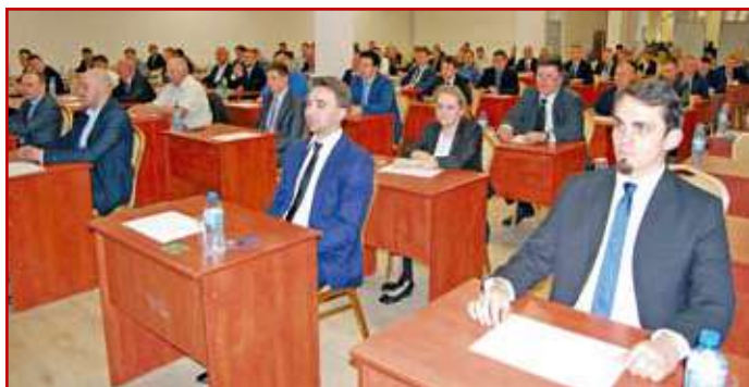
Egzamin pisemny w czasie XXVII sesji na uprawnienia budowlane w LOIIB

Uwzględniając fakt, że do ustnej części egzaminu mogą przystąpić osoby, którym nie powiodło się w listopadzie ubiegłego roku, to teoretycznie w maju mogło uzyskać uprawnienia budowlane prawie 300 osób. W rzeczywistości odsetek osób, które pozytywnie zaliczają test i egzamin ustny kształtuje się na poziomie 80%.