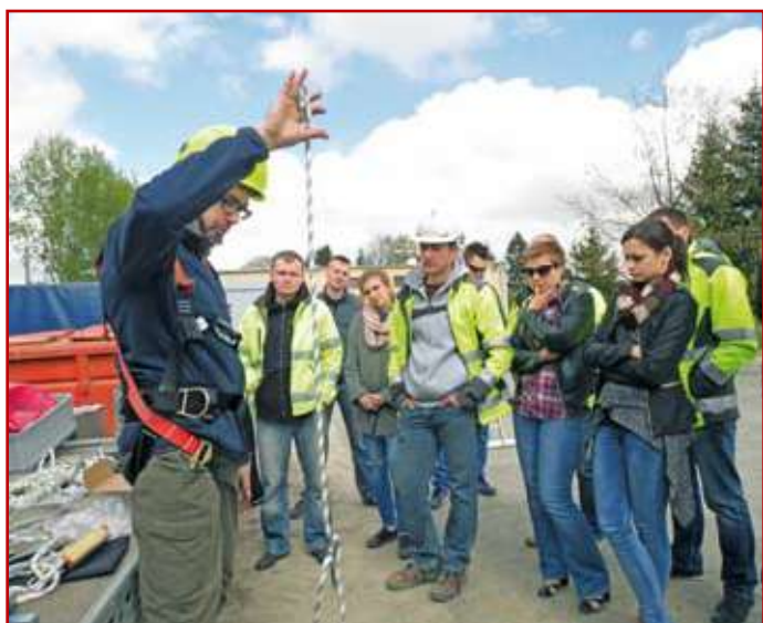
Pokazy i szkolenia związane z bezpieczeństwem podczas wykonywania robót budowlanych

Przygotowana na wykłady prezentacja multimedialna przedstawiała wypadki, jakie zaistniały na terenie województwa lubelskiego w ciągu ostatnich dwóch lat oraz takie, które miały miejsce w latach wcześniejszych, ale skutki ich były na tyle dotkliwe, że zasadnym było przypomnienie i zwrócenie uwagi na przyczyny zaistnienia. W trakcie spotkań zwracano także uwagę na sposoby ograniczania zagrożenia zawodowego oraz wskazywano na potrzebę stosowania sprzętu i środków zabezpieczających przed zagrożeniami związanymi z wykonywaną pracą.