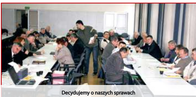
Decydujemy o naszych sprawach