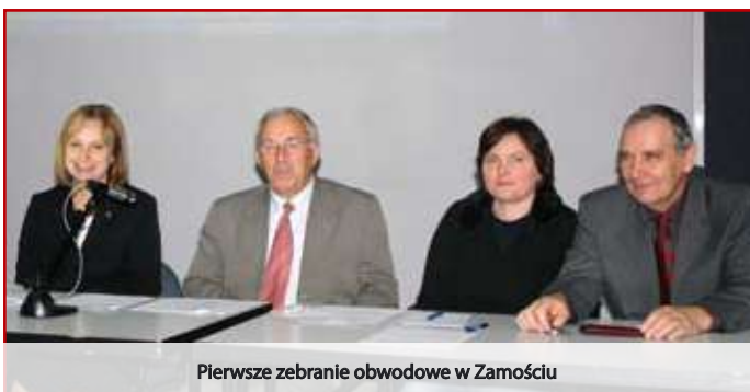
Pierwsze zebranie obwodowe w Zamościu