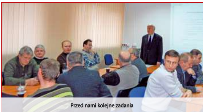
Przed nami kolejne zadania