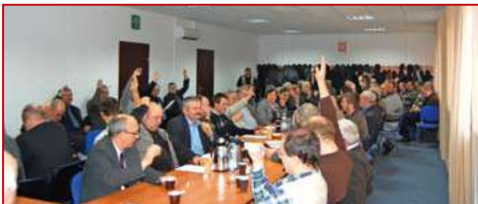
Głosując teraz decydujemy o przyszłości naszego młodego samorządu zawodowego