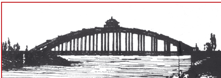
Widok mostu przez rzekę Wieprz w Kośminie 1841 r.

nych przyczółkach. Jak podają źródła historyczne budując ten most nie żałowano pieniędzy na jego upiększenie, umieszczając u góry łuków rodzaj „belwederku” – mającego z każdej strony po cztery słupki w kształcie kolumniek. Z tych samych dokumentów wynika, że był to jedyny tego okresu most, który wszedł jako przykład pięknej