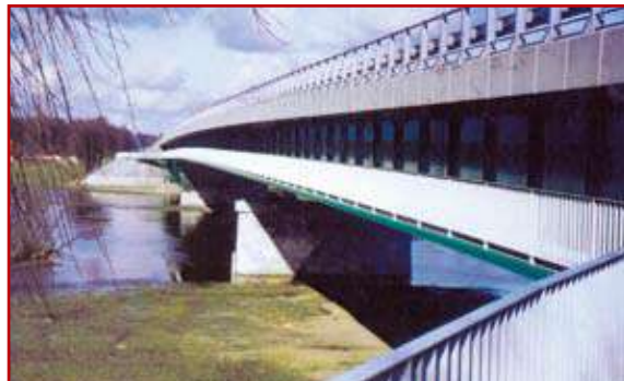
Widok mostu po przebudowie w 2001 r.

W wyniku wzrastającego ruchu drogowego, w tym głównie ruchu ciężkiego, obiekt w roku 2001 został