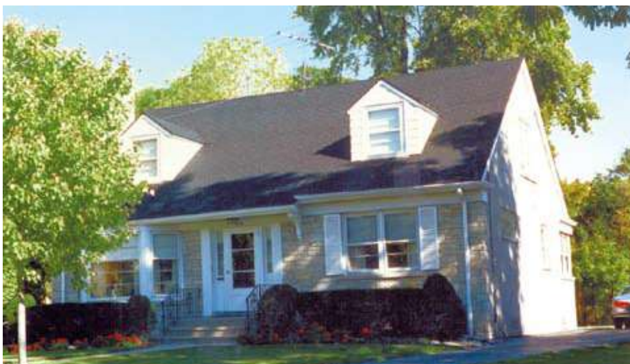
Wymagania techniczne i funkcjonalne w budownictwie zrównoważonych dotyczą także jakości samego procesu budowlanego m.in. zapewnienia warunków dla optymalnego użytkowania obiektu.

zakres dokumentów Unii Europejskiej związanych z energetycznym, a zatem ekologicznym aspektem rozwoju zrów- noważonego w budownictwie.