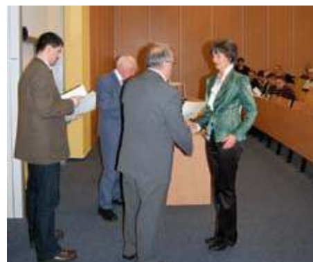
Już po egzaminie...