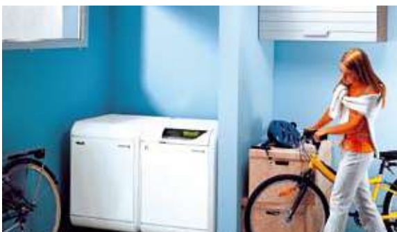
Wiele uwagi w budownictwie zrównoważonym poświęca się poprawie efektywności energetycznej budynków m.in. poprzez zastosowanie odpowiednich systemów grzewczych

zwala na oszacowania kosztów związanych z obiektem lub wyrobem budowlanym w całym cyklu jego życia. Uwzględniają one też nakłady inwesty-