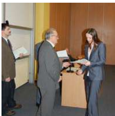
Przygotowania zostały uwieńczone sukcesem...