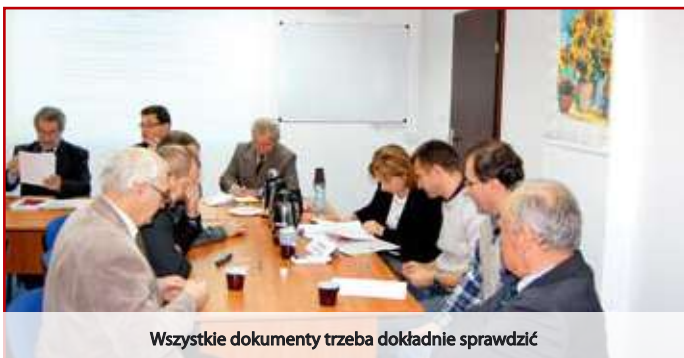
Wszystkie dokumenty trzeba dokładnie sprawdzić