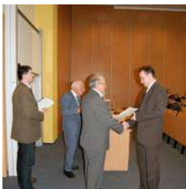
I już uprawnienia w rękę...