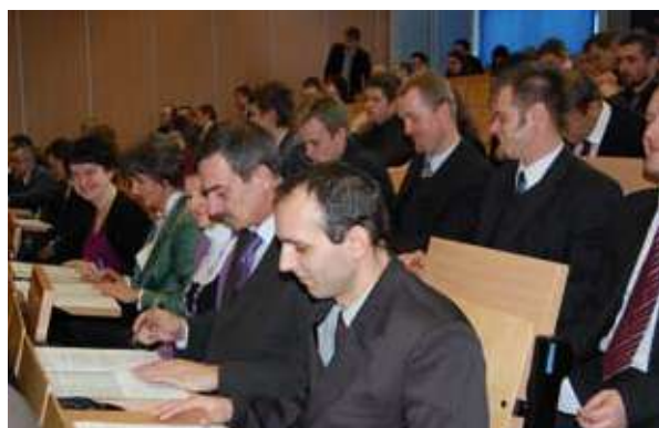
Szczęśliwa chwila, kiedy ogląda się swoje uprawnienia budowlane...