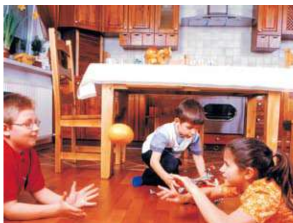
W budownictwie zrównoważonym szczególną uwagę zwraca się na mikroklimat w pomieszczeniach, w których przebywają ludzie

zamieszczone są w Rozporządzeniu w sprawie warunków technicznych, jakim powinny odpowiadać budynki i ich usytuowanie. Z kolei uwzględnienie efektywności energetycznej na etapie eksploatacji budynku możliwe będzie głównie przy wykorzystaniu narzędzi oceny w postaci świadectwa charakterystyki energetycznej budynku. Na