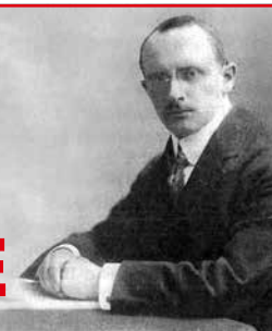
Stefan Bryła w 1920 r. jako młody naukowiec

Stefan Bryła był autorem pierwszego w świecie mostu spawanego, który stał się światową rewelacją, opisywaną w literaturze technicznej kilkudziesięciu państw, z Japonią włącznie. Był nie tylko wybitnym inżynierem, ale przede wszystkim niesamowitym człowiekiem. Dlatego też chciałbym, chociaż w skrócie, przedstawić jego sylwetkę.