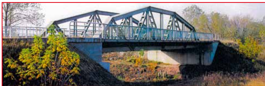
Most na Słudwi w Maurzycach po przeniesieniu jako „zabytek kultury narodowej”