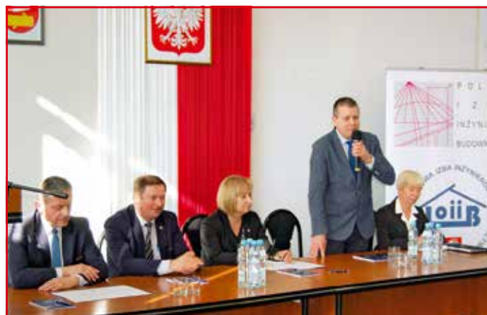
Przemawia S. Niebrzegowski, starosta radzyński