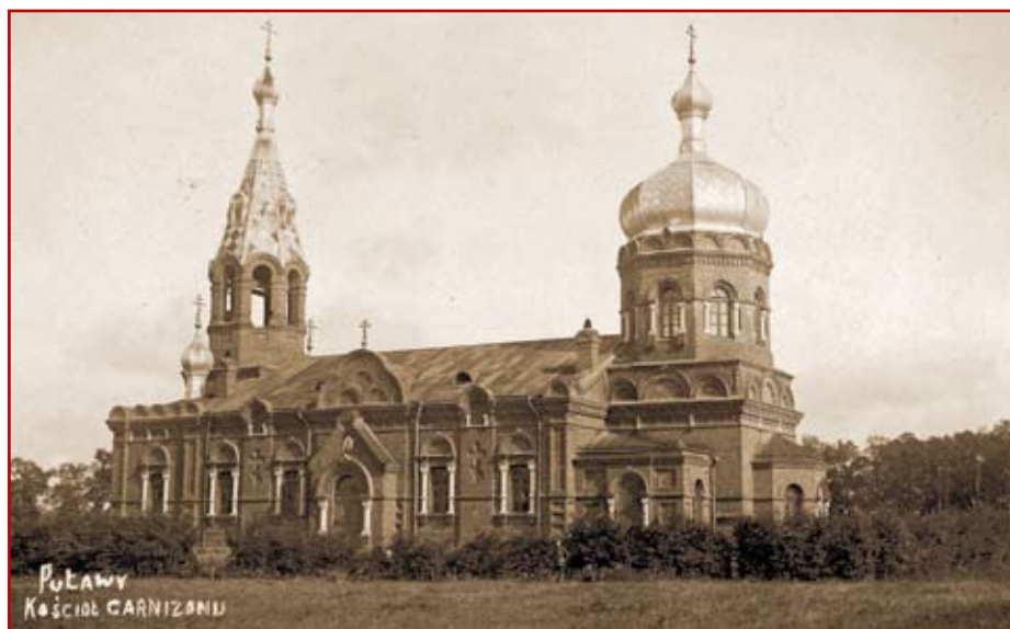
Fot.1. Cerkiew prawosławna wybudowana dla wojsk rosyjskich została wzniesiona w stylu bizantyjsko-ruskim, z ceglаныmi gzymsami kordonowymi stanowiącymi horyzontalne podziały elewacji. Gzymsy wieńczące istnieją w formie kroksztynek. Widok około 1910 r.

Powojenną historię zdominowała decyzja o budowie Zakładów Azotowych w północnej części miasta, podjęta przez polskie władze w 1960 r. Obecnie Puławy są miastem przemysłowym z rozwiniętymi ośrodkami naukowymi: Instytut Upraw Nawożenia i Gleboznawstwa, Państwowy Instytut Weterynarii, Oddział Pszczelnictwa Instytutu Sadownictwa, Instytut Nawozów Sztucznych.