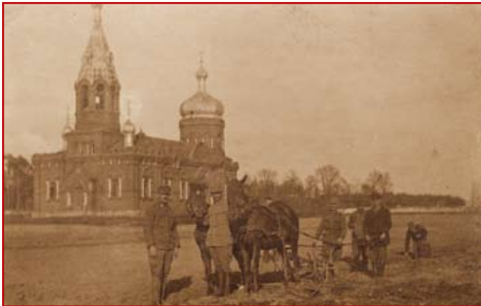
Fot. 2. Cerkiew w Puławach w 1917 r.

Po przybyciu do Puław we wrześniu 1921 r. 2 Pułku Saperów Kaniowskich pod dowództwem mjr Artura Górskiego przystąpiono do przebudowy cerkwi. Od 25 października 1921 r. dotychczasowa cerkiew stała się katolickim kościołem garnizonu pod wezwaniem Zmartwychwstania Pańskiego. Z wnętrza obiektu usunięty został ikonostas, a na jego miejscu powstał ołtarz i ambona. Obcięto poprzeczki z krzyży prawosławnych, przekształcając je na katolickie krzyże, doszło do zmiany sterczyn, które pierwotnie były zwieńczone kopułami – zlikwidowano je.