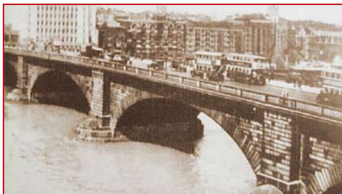
Fot. 2. Most na Tamizie "London Bridge" wybudowany w roku 1831 eksploatowany do roku 1971

Kiedy decyzja J. Rennie o rozbiórce starego mostu była ostateczna i kiedy zgodę wyraził parlament, wówczas J. Rennie opracował szczegółowy projekt. Była to konstrukcja składająca się z 5 przęseł o rozpiętości: 39,6–42,7–46,3–42,7–39,6 m. Niestety, J. Rennie nie dożył realizacji swojego dzieła. Zmarł 4 października 1821 r. Budowę mostu powierzono synowi Renni – Johnowi. Nowy most Londyński oddano do użytku w 1831 r. Przetrwał do 1972 r. Most ten z uwagi na to, że nie spełniał warunków wzrastającego ruchu postanowiono rozebrać, ale jego konstrukcja nie zakończyła swego żywota. Trafił się bowiem kupiec, a był nim amerykański przedsiębiorca Robert P. McCulloch, który postanowił rozebrać most, wykorzystać granitowe bloki i przetransportować je na kontynent amerykański. Z bloków tych zbudował replikę mostu w Lake Havasu City na pustyni w Arizonie, nad przekopany specjalnie kanałem łączącym jezioro Havasu z Thomson Ray. Budowa tego mostu została zakończona w 1971 roku, a most nazwany został „London Bridge”, stając się atrakcją turystyczną.