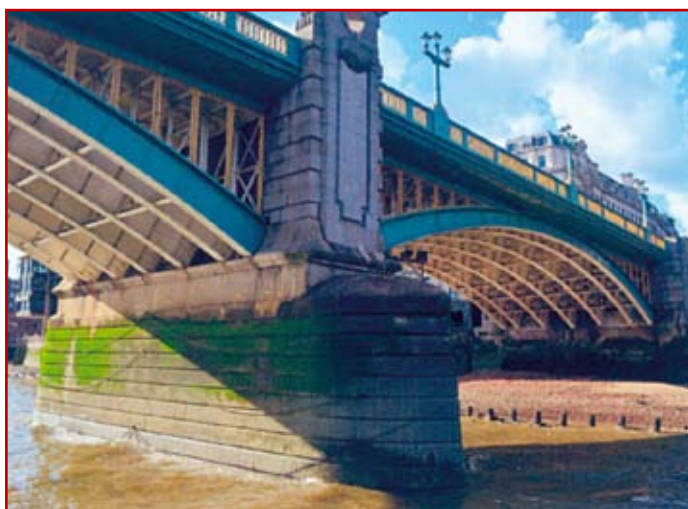
Fot. 7. Most Southwark. Wybudowany w roku 1921. Stan obecny.

Gdy most miał być otwierany, Londyn odwiedził rzeźbiarz we-necki A. Canova, który nazwał ten most „najbardziej imponującym mostem świata”. Stał się również najbardziej ulubionym mostem