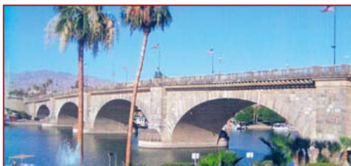
Fot. 3. Most "London Bridge" w Arizonie

Obecny most Londyński, to trzy przęsłowa konstrukcja z betonu sprężonego, jednak nie tak kochany, jak dwa poprzednie. Most posiada długość 249 m i szerokość 32 m. Został przekazany do ruchu w 1973 r.