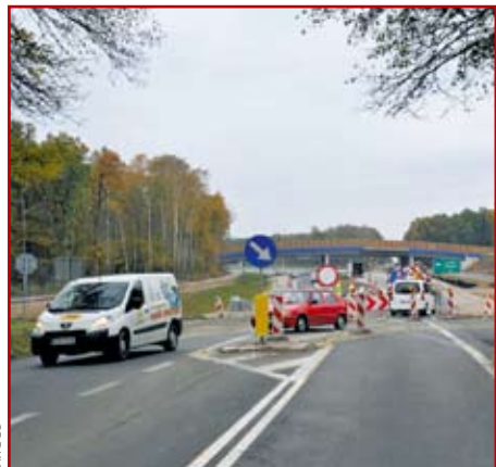
Pierwsze samochody na budowanej S19

Koncepcja programowa dla S19 na odcinku od węzła „Dąbrowica” (Lublin – Sławinek) do węzła „Konopnica” (Lublin – Węglin) obejmowała sześć wariantów autorskich i siódmy „gminny”, przebiegające przez tereny