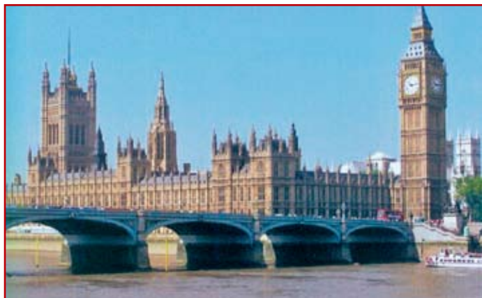
Fot. 4. Most Westminster'ski. Stan obecny. Najstarszy most londyński.

Most ten oddano do użytku w roku 1862. Do 1952 r. kursowały po nim pociągi, a obecnie przeznaczony jest dla ruchu pieszego i samochodowego. W 2005 r. poddano go gruntownej odnowie i wzmocnieniu, które to prace zakończono w 2007 r. Przy okazji tych prac odmalowano całą fasadę mostu na kolor zielony, a jak twierdzą londyńczycy na taki sam kolor, jak skórzane obicia w sąsiadującej z nim Izbie Gmin. Most Westminster'ski jest najstarszym obecnie mostem Londynu.