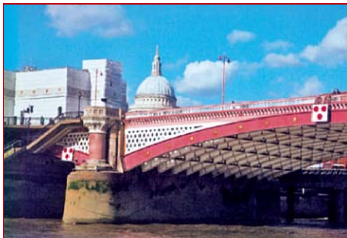
Fot. 5. Most Blackfriars. Po przebudowie w latach 1860–1910. Stan obecny.

Ówczesny most nazywany był „William Pitt Bridge” na cześć premiera Williama Pitta.