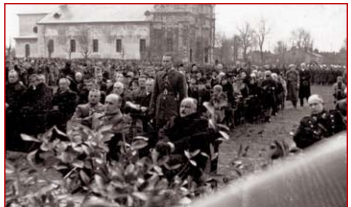
Fot. 4. Generalna przebudowa obiektu kwiecień-sierpień 1938 r.

Naprawy obiektów sakralnych ujmowano w planach napraw (gruntownych konserwacjach). Roboty awaryjne były wykonywane po zgłoszeniu ich przez użytkownika lub jako wynik przeglądu technicznego. Zarówno konserwacja bieżąca, jak i poważniejsze roboty remontowe mogły wykonywać organy służby zakwaterowania i budownictwa (organy wojskowe) po uzgodnieniu z bezpośrednim użytkownikiem, którym był proboszcz garnizonu. Wyjątek stanowiły naprawy sprzętu i wyposażenia obiektu: