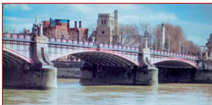
Fot. 6. Most Vauxhall Lambeth Bridge. Wybudowany w 1932 r. Stan obecny.

Pierwszym mostem tego okresu był most w Lambeth na Tamizie. Most ten miał pięć łukowych przęseł żelaznych o rozpiętościach 23,8 m, o czterech pasach ruchu i przeznaczony był dla pieszych oraz ruchu drogowego. Zlokalizowany był pomiędzy Westminster Bridge, a Vauxhall Bridge. Bezpośrednio odpowiedzialnym za budowę tego mostu, jak również dwóch następnych był John Rennie. Z tym, że ten ostatni został dokończony już po jego śmierci. Most został oddany do eksploatacji 12 czerwca 1932 r. Uroczystego otwarcia dokonał król Jerzy V. Pierwotną budowlą w miejscu obecnego mostu był wiszący most o łącznej długości 270 m, otwarty dla ruchu w 1862 r. Do roku 1879 korzystanie z mostu było płatne. Charakteryzując obecny most Lambeth można zauważyć, że po jego wschodniej części znajduje się pałac Lambeth – oficjalna rezydencja arcybiskupa Canterbury oraz Międzynarodowa Organizacja Morska, a w zachodniej części usytuowana jest dzielnica Westminster.