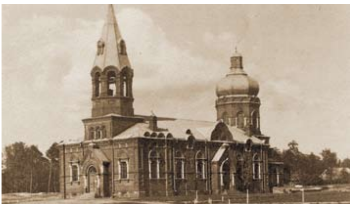
Fot. 3. Porównując fot. 1 i 3 z lat 1914 i 1917 r. można zauważyć, że całkowitej likwidacji uległy dwie małe kopuły nad wejściem. Nie zlikwidowano natomiast prawosławnych krzyży z elewacji obiektu

Po II wojnie światowej świątynia nadal pozostawała w rękach Wojska Polskiego. Dopiero 7 października 1975 r. zawarto umowę w sprawie utworzenia parafii przy kościele garnizonowym pomiędzy Biskupem Lubelskim, a Generalnym Dziekanem Wojska Polskiego. Świątynia funkcjonowała jako parafia cywilno-wojskowa do 8 lipca 1984 r. W tym czasie strona wojskowa odstąpiła od umowy i parafia cywilna została rozwiązana. W 1997 r. ponownie utworzono parafię cywilno-wojskową. Z tego okresu nie zachowało się zbyt wiele dokumentów świadczących o tym, jakie konkretnie roboty budowlane realizowane były w obiekcie. Ksiądz kanonik mgr Piotr Treła, proboszcz Parafii Matki Bożej Różańcowej, Dziekan Dekanatu Puławskiego próbował kilka lat temu uzyskać od instytucji wojskowych archiwalną, starą dokumentację obiektu, ale niestety akta nie zostały odnalezione.