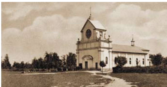
Fot. 5. Widok kościoła katolickiego około 1941 r. z okresu okupacji niemieckiej. Obiekt po generalnej przebudowie. Ślady po dawnej cerkwi są niewidoczne. Kościół został otynkowany i pomalowany