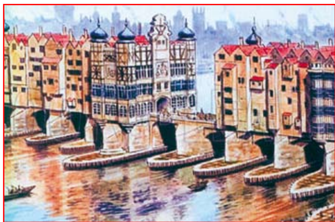
Fot. 1. Old London Bridge. Lata budowy 1176–1209. Eksploatowany przez 600 lat

Początkowo na moście nie było żadnej zabudowy i most służył tylko do przejazdu. Z czasem jednak, podobnie jak inne tego typu mosty miejskie obrósł drewnianymi domami, po obu stronach wąskiej jezdnii. Według danych historycznych na moście było około 100 domów, a niektóre z nich były 3, a nawet 4 piętrowe. Były tu również sklepy i magazyny. Po obu stronach mostu stały bramy, z których południowa była silnie ufortyfikowana i zamykana na opuszczaną kratę. Ponieważ most był ruchliwym, centralnym punktem miasta, dlatego też dla przestrogi, nieraz na jego balustradach wystawiano głowy przestępców, zdrajców i buntowników.