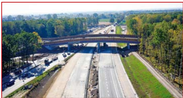
Budowa obiektu PZ z lotu ptaka

Świadczyły o tym daty podpisów osób protestujących, dołączone do pisemnych skarg. Konsultacje w gminie zazwyczaj zamieniały się w pyskówki. Pretensje i skargi spowodowały potrzebę opracowania zbiorczego zestawienia wszystkich wariantów (6+1), a ponadto dodatkowej analizy prastarego przebiegu trasy według zdezaktualizowanego miejscowego planu zagospodarowania przestrzennego gminy Konopnica i wariantów ze studium. W zestawieniu, dla poszczególnych