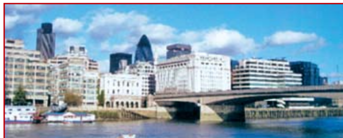
Fot. 3. Nowy most Londyński wybudowany w 1937 r. Stan obecny

Obecny most Londyński, to trzy przęsłowa konstrukcja z betonu sprężonego, jednak nie tak kochany, jak dwa poprzednie. Most posiada długość 249 m i szerokość 32 m. Został przekazany do ruchu w 1973 r.