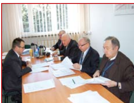
Egzamin ustny w LOIIB

Tyle w skrócie o procentach, natomiast w liczbach bezwzględnych w pierwszej sesji egzaminacyjnej 2016 r. na 2818 nadanych uprawnień w skali kra-