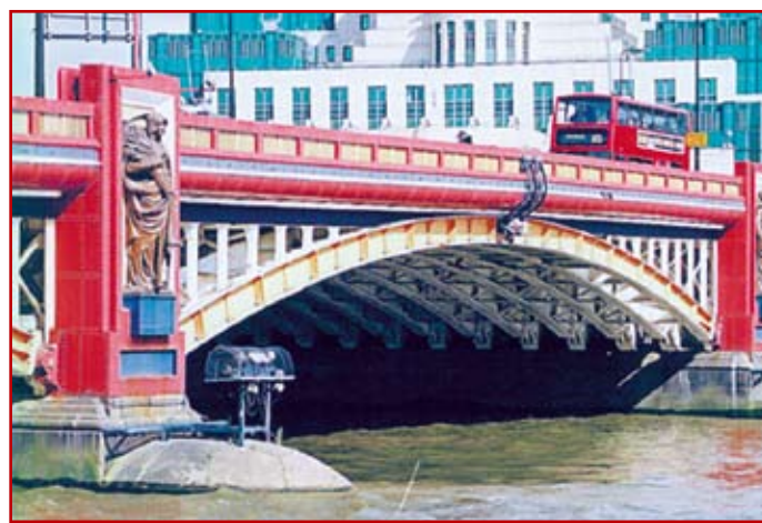
Fot. 8. Vauxhall Bridge. Przekazany do ruchu w 1906 roku. Stan obecny.

Most o konstrukcji stalowej w Vauxhall na Tamizie usytuowany jest pomiędzy mostami Lambeth Bridge i Grosvenor Bridge, w południowej dzielnicy Westminster. W pobliżu mostu znajduje się ujście rzeki Effra. Budowa mostu, a właściwie przebudowa mostu starego o podobnej konstrukcji została ukończona w 1906 r.