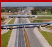
Zachodnia obwodnica Lublina

Z okazji zbliżających się Świąt Bożego Narodzenia życzymy Państwu, aby były one pełne optymizmu i zrozumienia, a nadchodzący Nowy Rok 2017 był czasem osobistej i zawodowej realizacji, spełnienia wszelkich marzeń oraz obfitował w sukcesy i wszelką pomyślność życzy