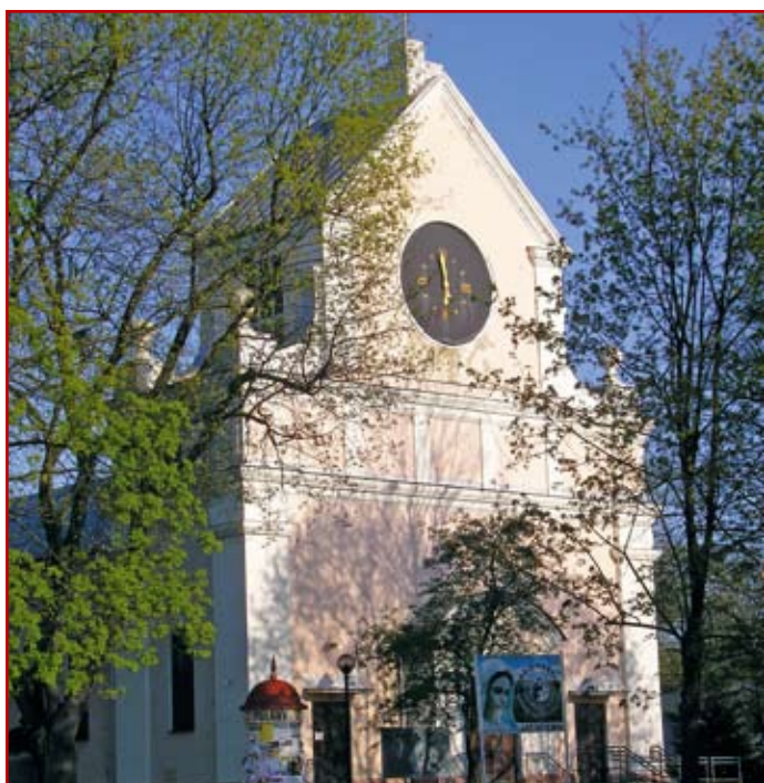
Fot. 7. Elewacja północno-zachodnia kościoła pod wezwaniem Matki Bożej Różańcowej w Puławach

Oczywiście funkcjonują także przyłącza do budynku: energetyczne i wodno-kanalizacyjne oraz wewnętrzna instalacja: elektryczna światła i siły, przeciwpożarowa, ogrzewanie elektryczne i wodno-kanalizacyjne.