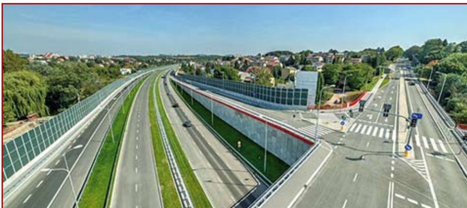
3. Aleja Solidarności – pod ul. Warszawską

W latach osiemdziesiątych ubiegłego wieku, odcinkami realizowano jej dalszy przebieg w kierunku Kalinówki (Zamościa) i tak: – al. Tysiąclecia przedłużona została do ulicy Hutniczej, wraz z węzłem drogowym; – odcinek za torami kolejowymi to obecnie aleja Wincentego Witosa; – najpóźniej zrealizowany został środkowy odcinek z wiaduktem kolejowym. Aleja W. Witosa po jej wybudowaniu, do czasu oddania do użytku wiaduktu kolejowego, była ulicą lokalną oraz wykorzystywaną, jako miejsce cotygodniowej giełdy samochodowej i trasa rowerowa.