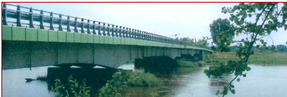
Zdj. 5. Most w Jeziorzanach