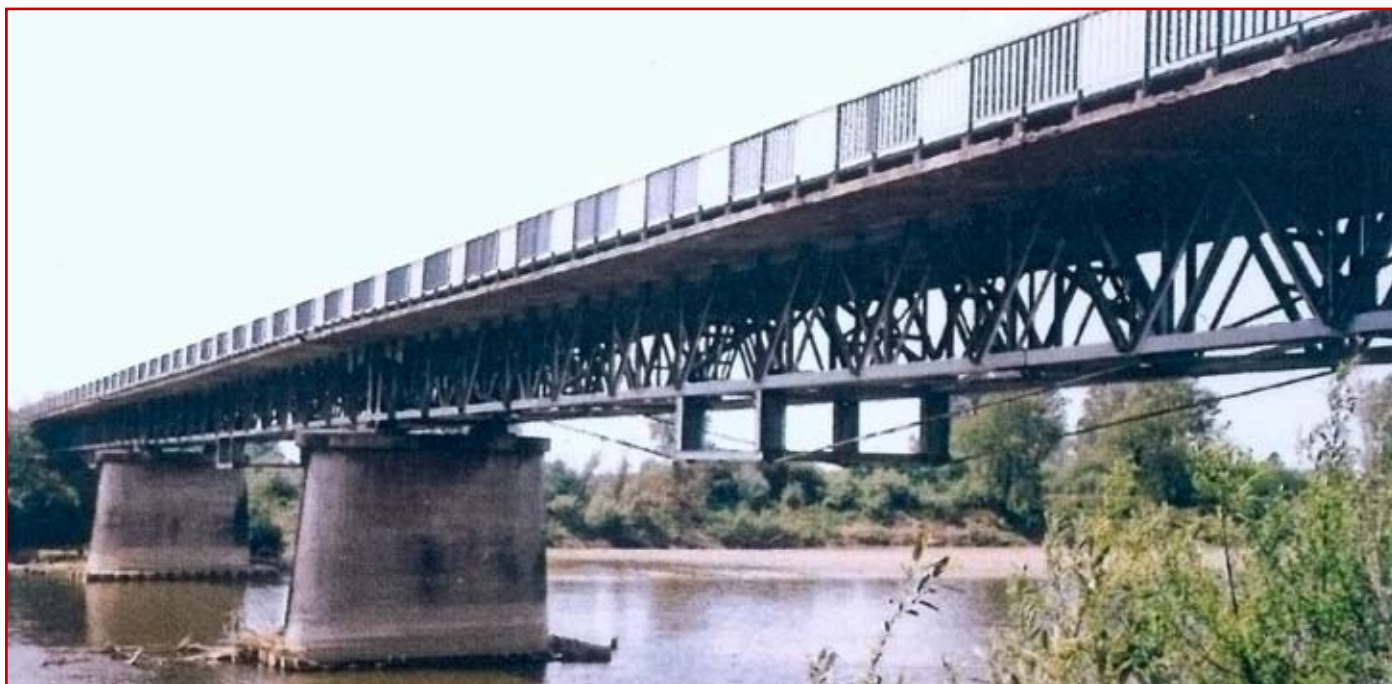
Zdj. 6. Most na rzece San w Ulanowie