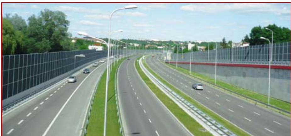
1. Aleja Solidarności – wlot do centrum Lublina

jazd obserwowali z Górek Czechowskich, wówczas mniej zadrzewionych. Warto tu nadmienić, zwłaszcza dla młodego pokolenia, że w tamtych czasach brak było pokrycia podkładami geodezyjnymi dużej części miasta Lublina i generalnie całej przestrzeni terenów podmiejskich i pozamiejskich. Zatem opracowania projektowe były poprzedzane pomiarami para-geodezyjnymi, wykonywanymi przez projektantów dróg (ulic) i w oparciu o nie, były opracowywane projekty techniczne. Należy również poinformować, że trasa ta przebiega w dolinie rzeki Czechówki po gruncie słabonośnym i posadowiona jest na bardzo grubej warstwie torfu (6-8 m). Rozwiązanie konstrukcji jezdni na