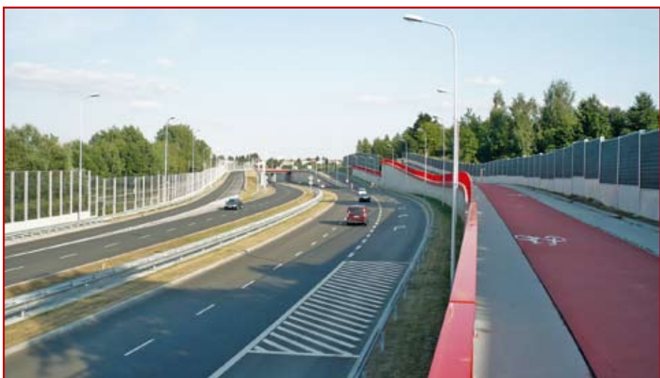
2. Aleja Solidarności – węzeł Sławin

tem odcinku, na owe czasy było dość nowatorskie. Na przełomie lat siedemdziesiątych i osiemdziesiątych powstały nowe ulice na Czechowie – al. Lenina i al. Kompozytorów Polskich skomunikowana z al. Tysiąclecia.