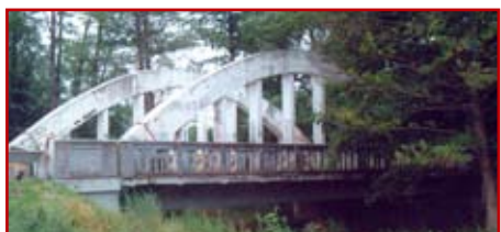
Zdj. 2b. Most na rzece Białej Ładzie w Biłgoraju obecnie