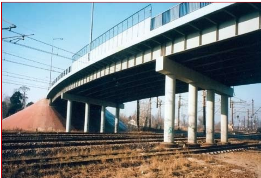
Zdj. 8. Wiadukt nad linią kolejową Warszawa - Lublin w Dęblinie

Po likwidacji obwodów mostowych, prowadzone naprawy i prace w zakresie