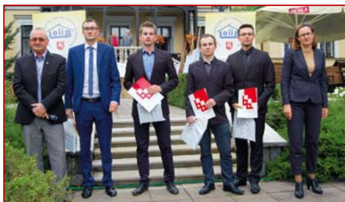
Laureaci nagrodzonych prac magisterskich

W czasie obchodów dokonano wręczenia także Honorowych Odznak Polskiej Izby Inżynierów Budownictwa członkom LOIIB, którzy swoją postawą, pracą zawodową oraz działalnością