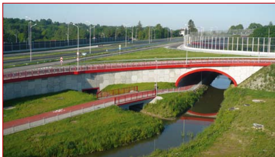
4. Aleja Solidarności z widokiem na rzekę Czechówkę

Przedłużenie al. Solidarności wybudowane zostało przez Budimex z zastosowaniem kolorystyki podkreślającej niektóre elementy konstrukcyjne na trasie po obu