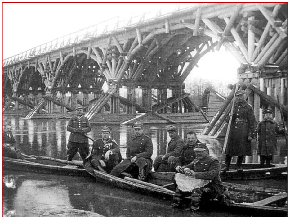
Zdj. 1. Most na rzece Bug w Sławatyczach