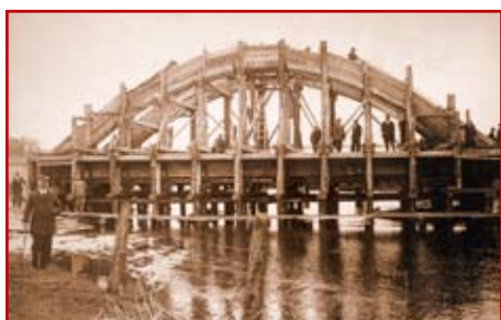
Zdj. 2a. Most na rzece Białej Ładzie w Biłgoraju w czasie budowy