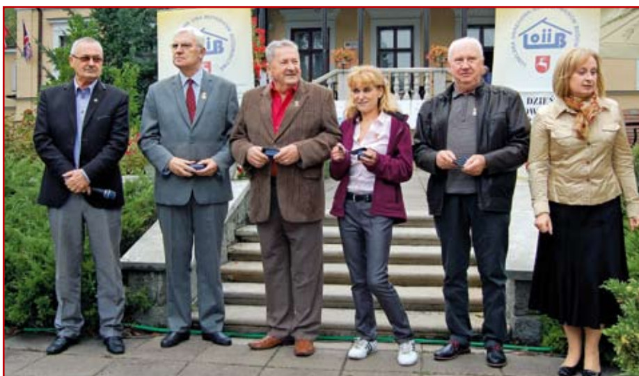
Członkowie LOIIB odznaczeni Złotymi Honorowymi Odznakami PIIB