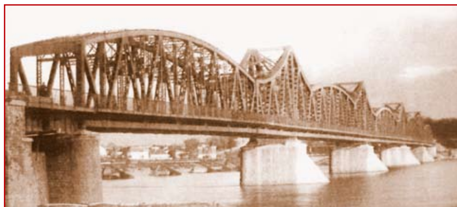
Zdj. 3. Most przez rzekę Wisłę w Puławach