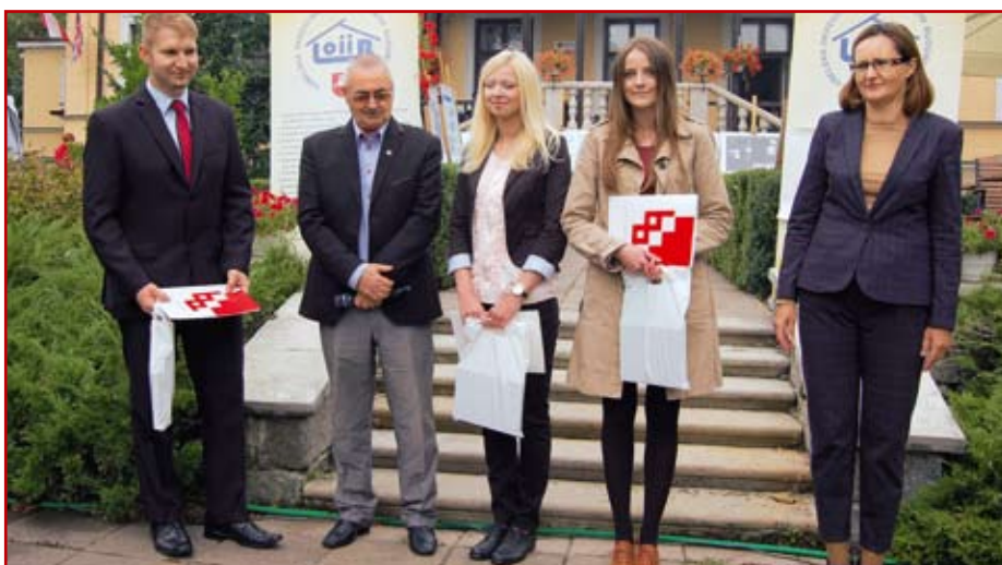
Laureaci nagrodzonych prac inżynierskich