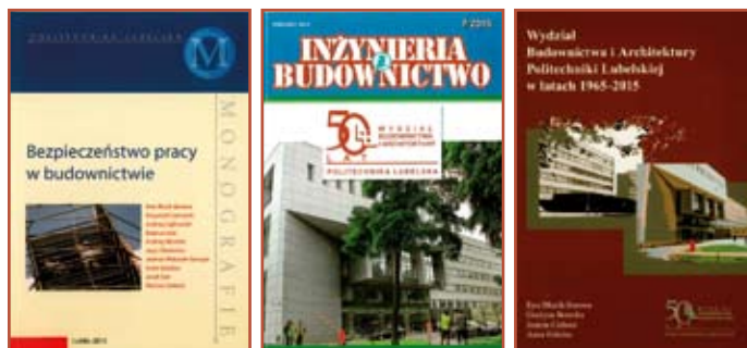
Niektóre z wydawnictw jubileuszowych

Z okazji jubileuszu wydana też została książka „Wydział Budownictwa i Architektury Politechniki Lubelskiej w latach 1965–2015”, w której opisano historię Wydziału i jego aktualną działalność. W książce tej dołączono spis wszystkich pracowników oraz absolwentów Wydziału. Następnym wydawnictwem była książka „Bezpieczeństwo pracy w budownictwie”, w której zamieszczono referaty z konferencji. Sylwetki Profesorów Honorowych PL zostały przedstawione w kolejnych publikacjach. Powstało także specjalne wydanie czasopisma „Inżynieria i Budownictwo”, w którym zamieszczono artykuły autorstwa pracowników Wydziału.