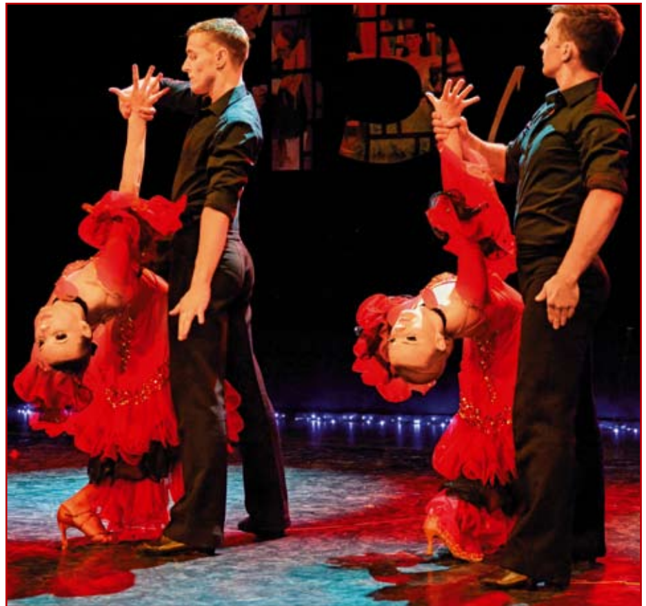
Mistrzowskie wykonanie i ciekawe układy taneczne zachwyciły publiczność