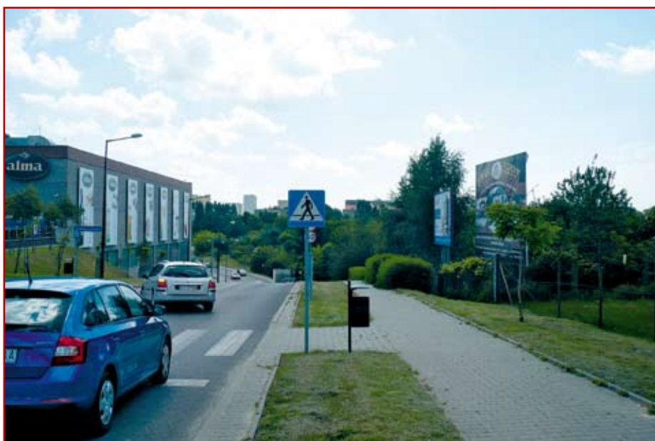
Ul. Bursaki – znikające samochody w zagłębieniu niwelety przed skrzyżowaniem

» Skrzyżowanie Al. Spółdzielczości Pracy z ul. Magnoliową (przy Olimpie), skrzyżowanie czterokierunkowe; kierunek główny – poprawny, dobrze funkcjonujący. Na kierunku podporządkowanym: wlot/wylot od strony Olimpu – trzy pasy ruchu, w tym pas dla lewoskrętów,