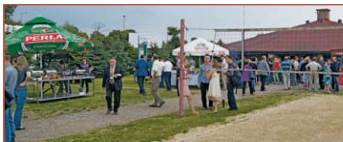
Piknik pracowników i absolwentów PL