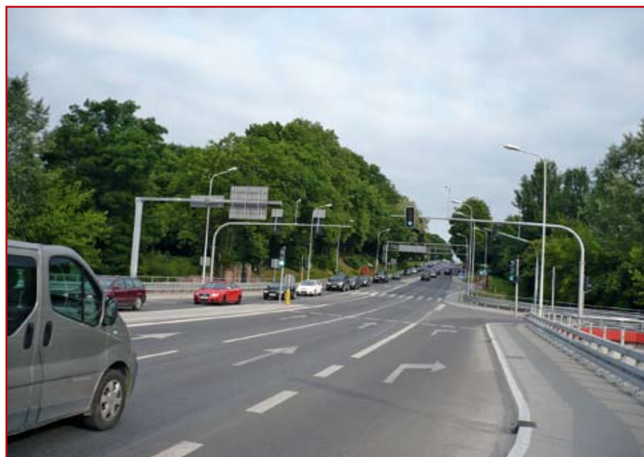
Al. Warszawska – ruch normalny

przebudowanym skrzyżowaniu, został spełniony. Efekty uwidocznił na jednym ze zdjęć w publikacji.