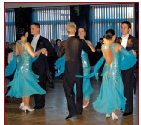
Tancerze „GAMZY” niejednokrotnie uświetniali swoimi występami także budowlane uroczystości. Pokaz w DT NOT w Lublinie w 2011 r.