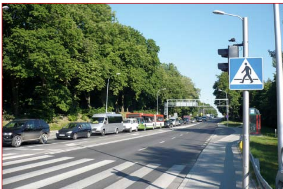
Al. Warszawska – okresowe korki od strony Jastkowa

Piętą achillesową tak projektantów dróg, jak i inwestorów, a dotyczy to wielu zarządców dróg, jest słaba znajomość zagadnień dotyczących analizy ruchu drogowego i jego rozkładu na skrzyżowaniach oraz węzłach drogowych i ich niedocenywanie. W Lublinie, na ważniejszych skrzyżowaniach ulic, dokonywane są coroczne pomiary ruchu z rozkładem kierunkowym. Dane te oraz analiza lokalizacji skrzyżowania w układzie komunikacyjnym miasta i prognoza ruchu, umożliwiają opracowanie kartogramów ruchu. Kartogramy te służą do określenia ilości wszystkich pasów ruchu na wlotach oraz długości dodatkowych pasów skrętnych. Następnie wraz z wstępną, możliwie dobrą organizacją ruchu powinny być podstawą do poprawnego zaprojektowania danego skrzyżowania lub węzła drogowego. Wielu projektantów o tym nie pamięta lub wręcz je pomija, a inwestorzy tego od nich nie egzekwują. Stąd wynikają wadliwie zaprojektowane i realizowane skrzyżowania. Ma to ujemny wpływ na