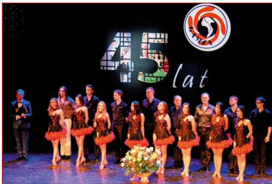
Jubileuszowy koncert z okazji 45-lecia działalności „GAMZY”