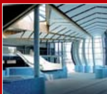
Aqua Lublin w Lublinie

Z okazji Dnia Budowlanych i Dnia Inżyniera Budownictwa wszystkim Członkom Lubelskiej Okręgowej Izby Inżynierów Budownictwa zadowolenia z wykonywanej pracy, spełnienia planów zarówno zawodowych, jak i osobistych, szczęścia i zdrowia