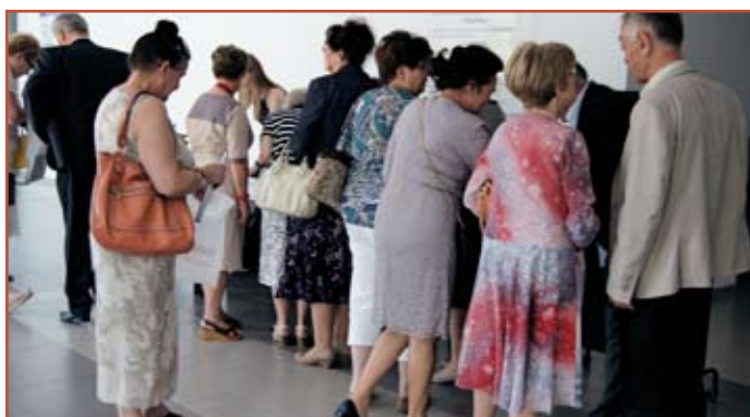
Kuluarowe rozmowy podczas spotkania byłych i obecnych pracowników Wydziału

W konferencji wzięło udział około 120 osób, reprezentujących środowisko naukowe, firmy budowlane oraz organy Głównego Urzędu Nadzoru Budowlanego i Państwowej Inspekcji Pracy. Referaty obejmowały problematykę bezpieczeństwa podczas prac budowlanych i zapobiegania wypadkom przy pracy w budownictwie, w tym także na rusztowaniach budowlanych. W związku z różnorodnością czynników, wpływających na bezpieczeństwo pracy w budownictwie, wśród osób referujących znaleźli się przedstawiciele takich instytucji, jak: Główny Urząd Nadzoru Budowlanego, Państwowa Inspekcja Pracy, Centralny Instytut Ochrony Pracy, Instytut Medycyny Pracy z Łodzi, Instytut Mechanizacji Budownictwa i Górnictwa Skalnego, Politechnika Lubelska i Politechnika Białostocka. Referaty zostały zebrane i wydane w formie książkowej.