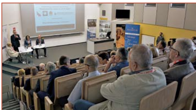
Sala obrad konferencji „Bezpieczeństwo pracy w budownictwie”

W konferencji wzięło udział około 120 osób, reprezentujących środowisko naukowe, firmy budowlane oraz organy Głównego Urzędu Nadzoru Budowlanego i Państwowej Inspekcji Pracy. Referaty obejmowały problematykę bezpieczeństwa podczas prac budowlanych i zapobiegania wypadkom przy pracy w budownictwie, w tym także na rusztowaniach budowlanych. W związku z różnorodnością czynników, wpływających na bezpieczeństwo pracy w budownictwie, wśród osób referujących znaleźli się przedstawiciele takich instytucji, jak: Główny Urząd Nadzoru Budowlanego, Państwowa Inspekcja Pracy, Centralny Instytut Ochrony Pracy, Instytut Medycyny Pracy z Łodzi, Instytut Mechanizacji Budownictwa i Górnictwa Skalnego, Politechnika Lubelska i Politechnika Białostocka. Referaty zostały zebrane i wydane w formie książkowej.