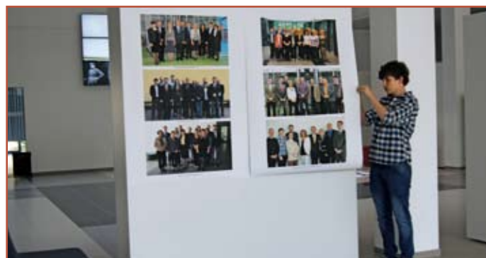
Jubileuszowa wystawa w holu WBIA PL

W holu WBIA zorganizowano wystawę fotografii ukazujących Wydział, jego pracowników i studentów, dawniej i dziś.