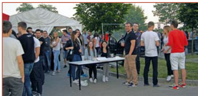
Piknik studentów WBiA

Jubileusz rozpoczęli aktualni studenci WBiA PL bawiąc się w dniu 11 czerwca br. na pikniku, który został przygotowany przez samorząd studencki Wydziału przy współudziale Fundacji Rozwoju PL. Piknik odbył się na terenach zielonych Politechniki Lubelskiej, a uczestniczyło w nim ponad 650 osób.