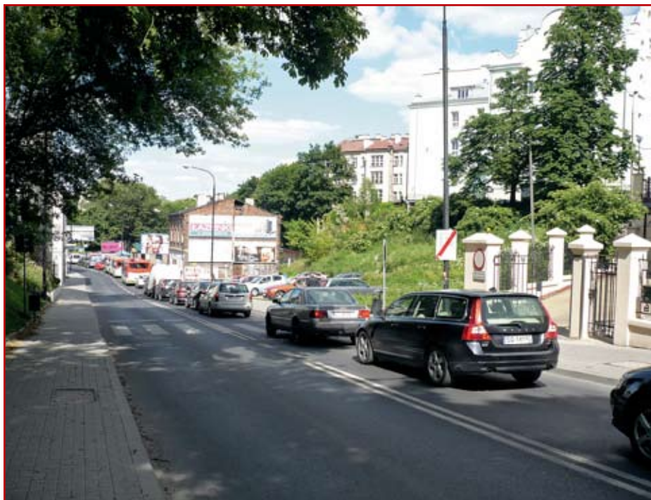
Ul. Dolna 3 Maja – korki, brak pasów skrętnych na wlocie do Al. Solidarności

granice pasa drogowego w układzie komunikacyjnym miasta (niejednokrotnie zbyt wąskie) i osoby je akceptujące. O poprawności działania skrzyżowania, zwłaszcza nowego, należy myśleć przed jego zaprojektowaniem, a nie dopiero po jego zrealizowaniu.