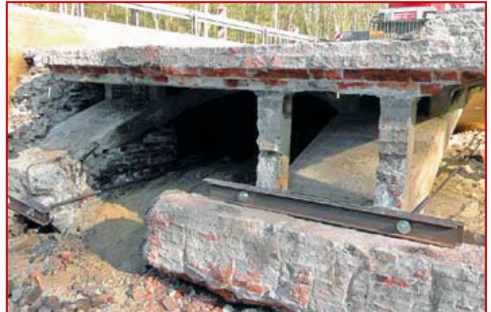
Zdj.2. Widok na most po rozbiórce przyczółków od strony Tomaszowa Lubelskiego

Most wybudowano ponad sto lat temu, ale przez ostatnie lata planiści nie zdawali sobie sprawy z jego istnienia. Na początku października 2014 r., podczas przebudowy drogi krajowej nr 17 na odcinku Łabunie Reforma – Polanówka, w miejscu przebudowywanego przepustu odnaleziono żelbetowy most. Wiadomość o obiekcie szybko rozeszła się pomiędzy członkami lubelskiego oddziału Stowarzyszenia Inżynierów i Techników Komunikacji RP oraz pracownikami Katedry Dróg i Mostów Politechniki Lubelskiej.