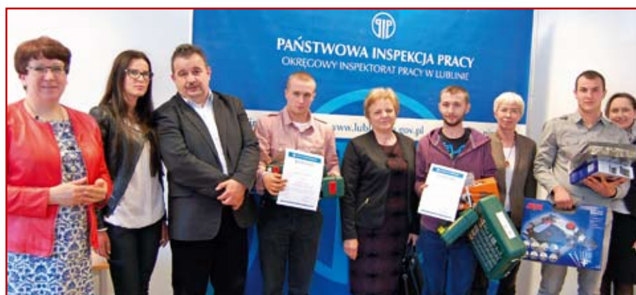
Laureaci konkursu z organizatorami

Nadinspektor pracy Okręgowy Inspektorat Pracy PIP w Lublinie