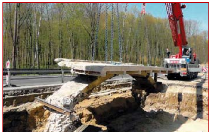
ciąg dalszy na str. 20