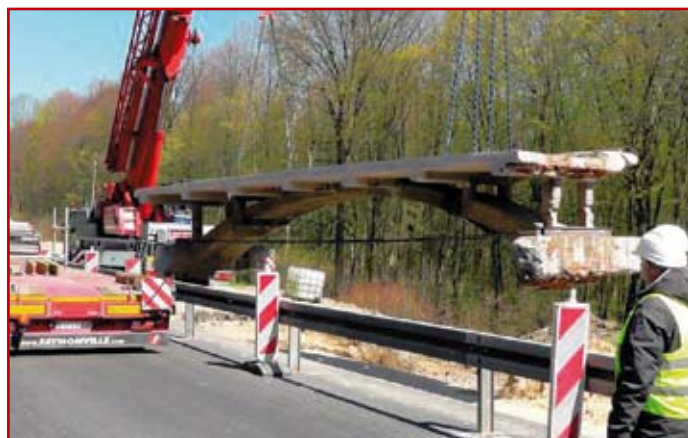
Zdj.3. Załadunek elementów obiektu na platformy

Konstrukcję nośną obiektu tworzą dwa łuki kołowe o promieniu 10 m, szerokości 120 cm i grubości ~33 cm. Na łukach poprzez słupki (6 i 7 par na łuk) spoczywa płyta żelbetowa, po której odbywał się ruch. W kluczu górna powierzchnia łuku styka się ze spodem płyty żelbetowej pomostu.