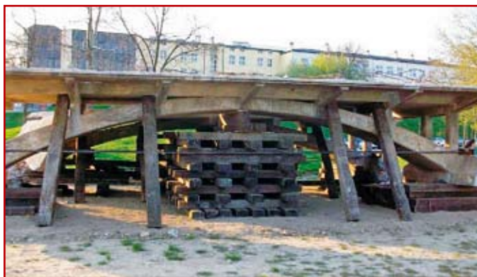
Zdj.4. Elementy mostu w tymczasowym miejscu na terenach zielonych Politechniki Lubelskiej