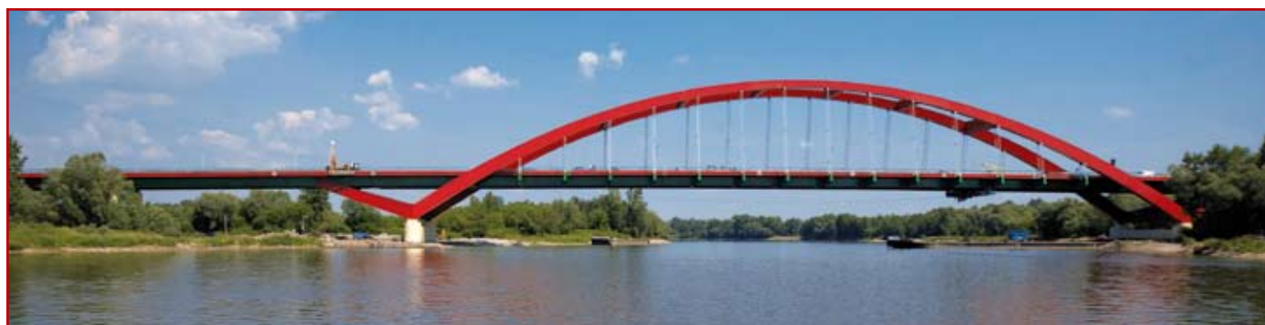
Most przez rzekę Wisłę w Puławach im. Jana Pawła II

Rozwój przemysłu stalowego wpływa w sposób istotny na tendencje rozwoju mostownictwa. Dotyczy to tak nowych gatunków stali, jak również coraz częściej wykonywanych z niej gotowych do wbudowania elementów konstrukcyjnych o dużej odporności na korozję. Obecnie powstało nowe określenie pod nazwą „stal HPS”, a dotyczy to stali wysokich właściwości. Stale te należą do nowej generacji materiałów konstrukcyjnych, odznaczających się lepszymi właściwościami, jak: wytrzymałość, granica plastyczności, spawalność, odporność na kruche pęknięcia oraz duża odporność na korozję. Do grupy tych stali należą stale trudno rdzewiejące. Odporność tej stali na korozję wynika z tego, że pod wpływem działania atmosfery stale te, zwane powszechnie „kortenowskimi” pokrywają się warstwą produktu korozji – rdzą podobnie, jak inne stale konstrukcyjne. Różnica polega na tym, że tworząca się rdza, choć w pierwszym okresie tylko nieznacznie różni się od rdzy na innych stalach, to w miarę upływu czasu wzbogaca się o związki siarki i fosforu ze składnikami takimi, jak miedź, chrom lub cynk, zmniejszającymi w sposób znaczący, właściwości rdzy. W rezultacie tego, na powierzchni stali trudno rdzewiejącej stopniowo tworzy się warstwa mało przepuszczalna, silnie przylegająca do jej