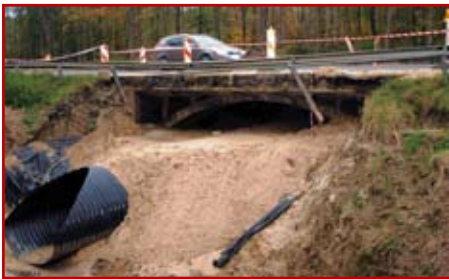
Zdj.1. Most schowany w nasypie – 21.10.2014 r.

Pracownicy Politechniki Lubelskiej niezwłocznie dokonali rozpoznania obiektu wykonując inwentaryzację oraz sklerometryczne badania betonu. Stan wizualny, wyniki badań oraz studia materiałów archiwalnych skłoniły do podjęcia próby ratowania obiektu datowanego na pierwszą dekadę XX wieku, a przeznaczonego do rozbiórki. Przesłanką działań było zachowanie jednego z najstarszych udokumentowanych obiektów żelbetowych na Lubelszczyźnie oraz pozyskanie pomocy dydaktycznej w zakresie mechaniki konstrukcji i kształtowania architektoniczno-przestrzennego. Działania ratunkowe zaakceptowały wszystkie środowiska, poinformowane o inicjatywie,