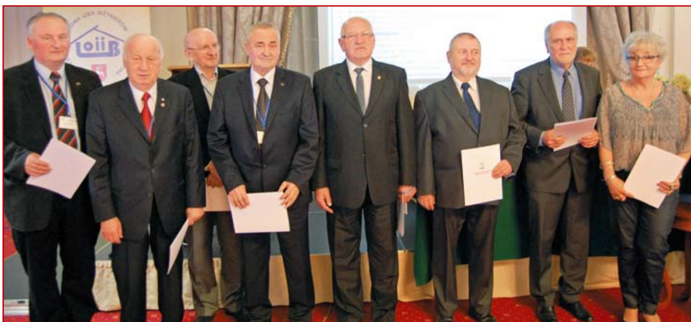
Wyróżnieni dyplomami z okazji 25-lecia polskiej transformacji