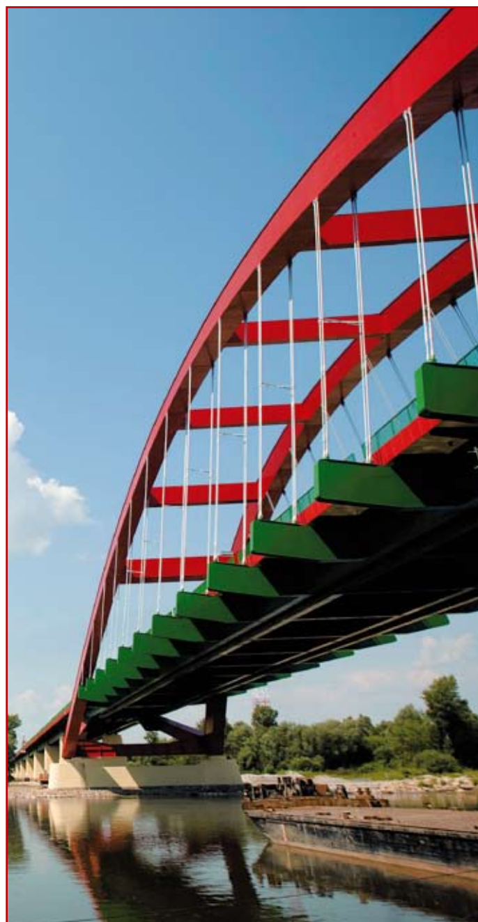
Dobrze zabezpieczony przed korozją most może służyć wiele lat