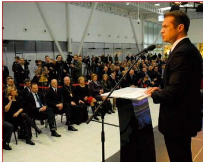
Sławomir Nowak minister transportu, budownictwa i gospodarki morskiej w swoim wystąpieniu zwrócił uwagę na zaangażowanie władz i społeczeństwa Lubelszczyzny w budowę Portu Lotniczego Lublin

1 grudnia 2012 r. zorganizowano dzień otwarty, na który przybyło ponad 20 tys. osób z całego regionu. 12 grudnia spółka otrzymała certyfikat dla lotniska z Urzędu Lotnictwa Cywilnego, natomiast 17 grudnia 2012 r. odbyło się uroczyste otwarcie terminala, podczas którego w Świdniku wylądował pierwszy samolot linii Ryanair i następnie odleciał do Londynu. Kolejnego dnia na płycie lotniska wylądował pierwszy raz samolot linii Wizz Air, który przywiózł i zabrał