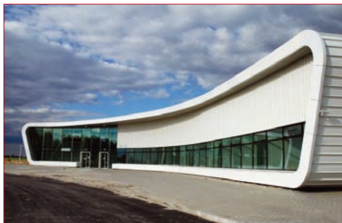
Port Lotniczy Lublin