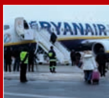
Port Lotniczy Lublin