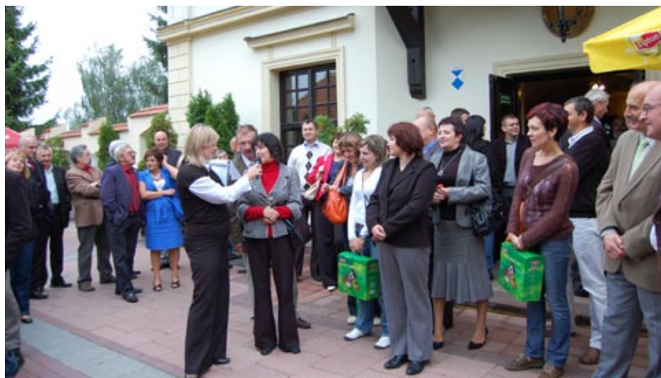
Chętnych do udziału w konkursach nie brakowało...

choć samorząd zawodowy inżynierów budownictwa jest samorządem młodym, gdyż funkcjonuje zaledwie dwie kadencje, to sporo już udało się. W. Szewczyk zauważył także, że „Dzień Budowlanych” to dobra okazja do refleksji i wymiany poglądów na temat sytuacji budownictwa, firm budowlanych, warunków pracy ludzi naszej branży. To okazja do rozmowy, na którą na co dzień często nie mamy czasu