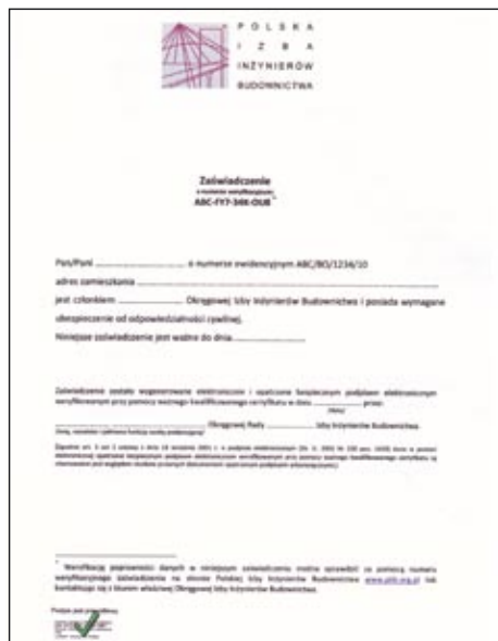
Wzór elektronicznego zaświadczenia członkostwa w Izbie

zaświadczenia przedstawia rys. 2. Fakt podpisania dokumentu będzie symbolizowany przez ikonkę podpisu elektronicznego w lewym dolnym rogu pliku PDF.