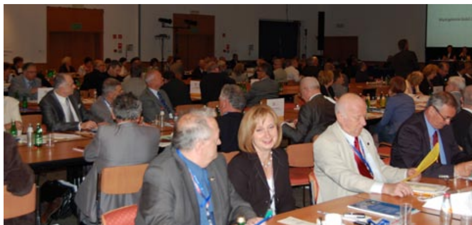
Lubelska delegacja w czasie obrad zjazdowych