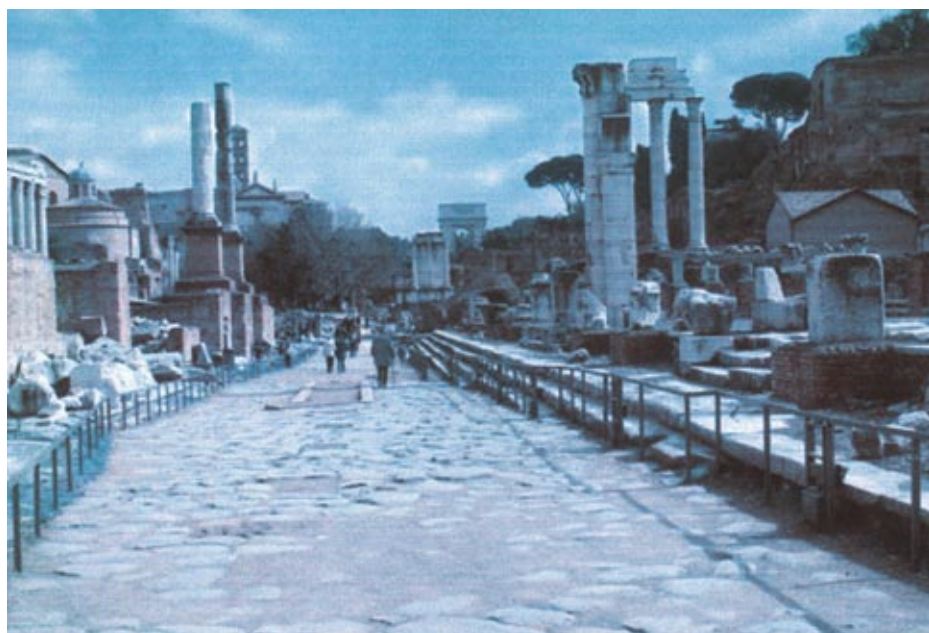
Via Appia (zdjęcie współczesne)

downictwo drogowe pomimo, że w swych początkach było syntezą osiągnięć wcześniejszych cywilizacji np. Krety czy Grecji, to