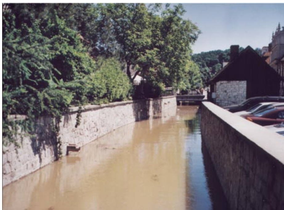
Mury oporowe chroniące Kazimierz Dolny

Wspomniana poprzednio konstrukcja wału, jako budowli ziemnej o przekroju trapezowym, jest rozwiązaniem najprostszym i najtańszym, ale niewątpliwie dość zawodnym. Była to konstrukcja powszechnie stosowana w wieku XIX i przez kilka dziesięcioleci wieku XX. Stopniowo narastała jednak świadomość wad takiego rozwiązania, a także świadomość potrzeby wprowadzenia dodatkowych zabezpieczeń zawali przed podtopieniem czy zatopieniem. Istniejące na Wiśle Lubelskiej wały stopniowo modernizowano