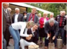
Na okładce: Spotkanie integracyj- ne LOiIB z okazji Dnia Budowlanych