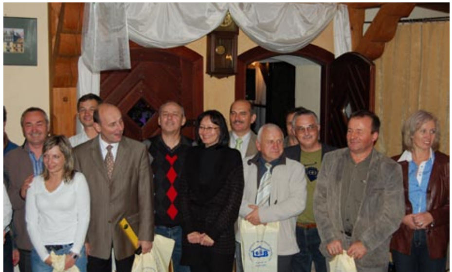
Najlepsi w organizowanych konkursach otrzymali zasłużone nagrody

do mocowania się na rękę i sprawdzenia „siły swoich mięśni”. Konkurencją całkowicie zdominowana przez panów, raz dopuściła do kręgu swoich uczestników także jedną z koleżanek.