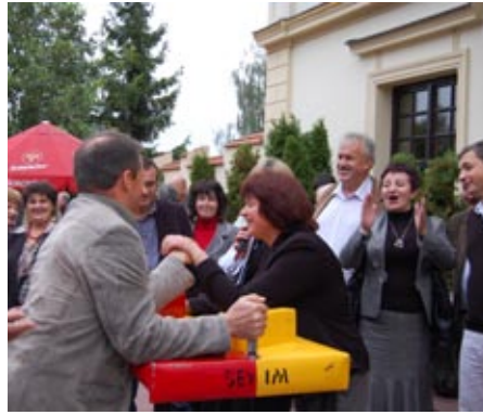
„Słaba płeć a jednak najsilniejsza”

Po tej oficjalnej, uroczystej części obchodów rozpoczął się program rekreacyjny. Wszyscy przybyli na spotkanie mogli brać udział w grach i zawodach przygotowanych na tę okazję. Rozpoczęliśmy od konkurencji „budowlanej”, czyli wbijania 8 calowych (dwóch) gwoździ w przygotowane solidne pieńki, nie za dużymi młotkami. Okazało się, że nie wszyscy mogli sobie sprawnie z tą czynnością poradzić, pomimo mocnego dopingu, a czasami wręcz pomocy koleżanek i kolegów. Nie brakło także chętnych