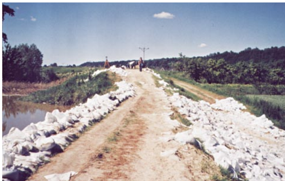
Wzmacnianie wałów w Parchatce

stawia obrazowo stan budowli ziemnej przesyconej przez filtrującą wodę, a więc w warunkach potencjalnego upłynienia gruntu i drastycznego pogorszenia jego parametrów technicznych.