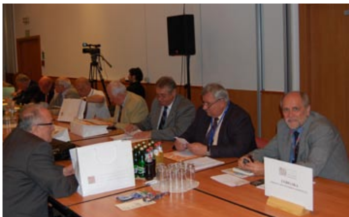
Przed kolejnym etapem obrad warto sprawdzić przygotowane materiały ...

W latach 2001-2005 był także wiceprezesem Komitetu Budownictwa działającego przy Krajowej Izbie Gospodarczej.