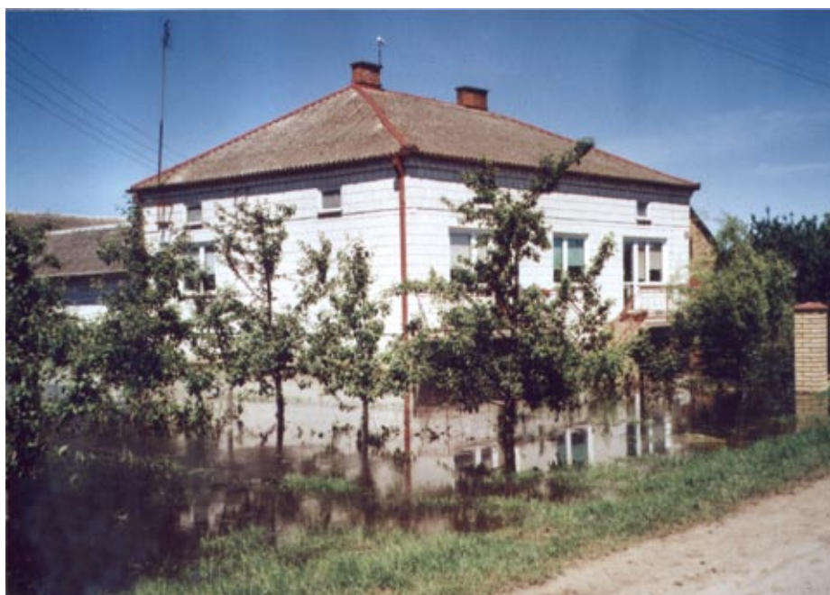
Zalane zabudowania i sady w Kępie Choteckiej

się, ewentualne zatamowania przepływu mogą być sporadyczne, w zasadzie tylko w okresach zimowych (zatory lodowe), a energia wody ostatecznie wymusi przejście fali powodziowej czy to drogą naturalną, czy też (w całości lub części) drogą nowo powstałą po przerwaniu naturalnych lub sztucznych przeszkód.