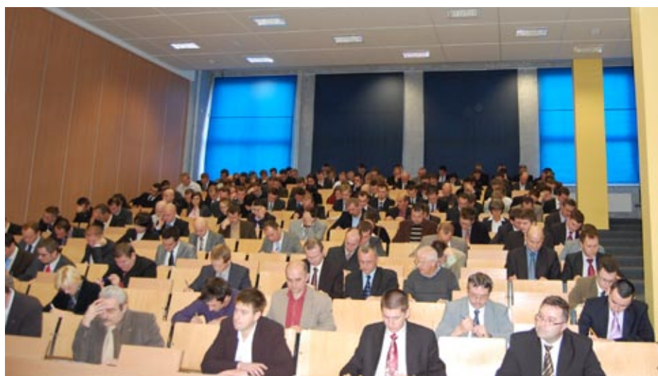
Prawie połowa ankietowanych stwierdza, że realizowany program nie zawiera wszystkich treści koniecznych do pracy w zawodzie.

gram nauczania na uczelni przygotował Panią/Pana do podjęcia pracy zawodowej pod względem, gdzie 2 oznacza, że nie przygotował, a 5 że przygotował.