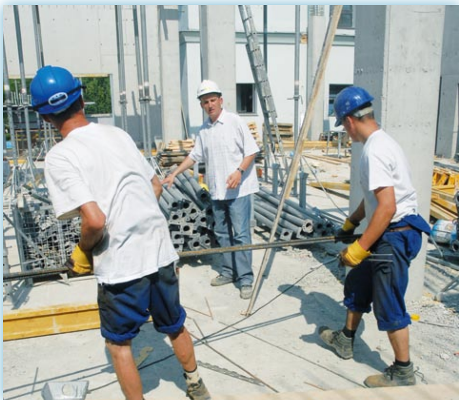
Usługodawcy świadczącemu usługi transgraniczne przysługują prawa, które nie mogą być ograniczane przez państwa członkowskie