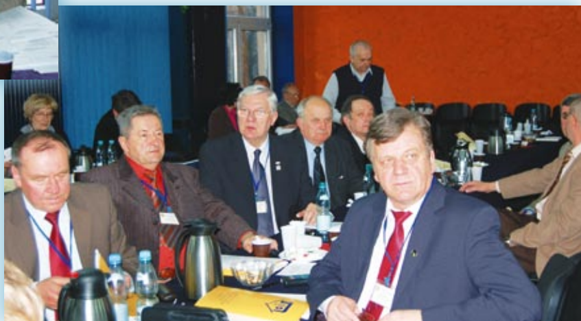
Uczestnicy obrad IX Zjazdu Sprawozdawczo-Wyborczego LOIB