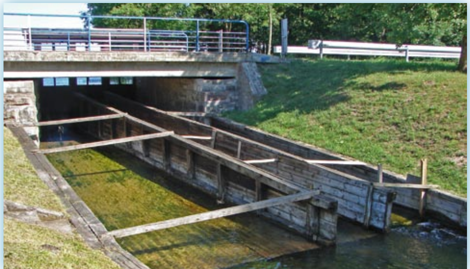
Jaz sucha Rzeczka

Kanał Augustowski położony jest w sercu jednego z najbardziej atrakcyjnych krajobrazowo i przyrodniczo regionów Polski. W jego otulinie znajdują się dwa parki narodowe: Wigierski i Biebrzański. W bezpośrednim sąsiedztwie Kanału znajduje się 5 rezerwatów przyrody (florystyczne, krajobrazowe, ornitologiczne), a w najbliższym czasie projektuje się objęcie ochroną rezerwatową dalszych pięciu cennych