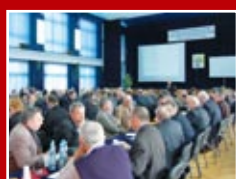
Członkowie LOIIB podczas IX Zjazdu Sprawozdawczo-Wy- borczego LOIIB