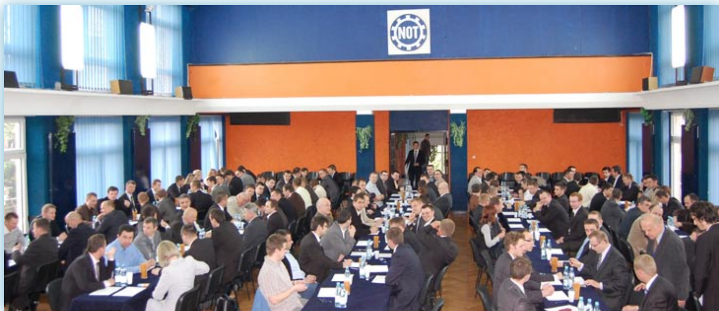
Sala egzaminacyjna przed rozpoczęciem egzaminu

Testy pisemne przygotowywane są przez Krajową Komisję Kwalifikacyjną poprzez wybór pytań z ogólnopolskiej bazy pytań. Testy zestawiane są dla poszczególnych specjalności i zakresów egzaminu. Zestawy pytań do części ustnej szykowane są przez Komisje Okręgowe z podobnej ogólnopolskiej bazy pytań. W całym kraju liczba pytań dla odpowiednich zakresów jest identyczna, a pytania dostosowane są do specjalności.