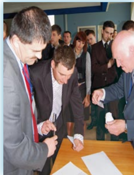
Jeszcze tylko trzeba sprawdzić dane...

osób, drogowa – 18 osób, mostowa – 3 osoby, telekomunikacyjna – 2 osoby.