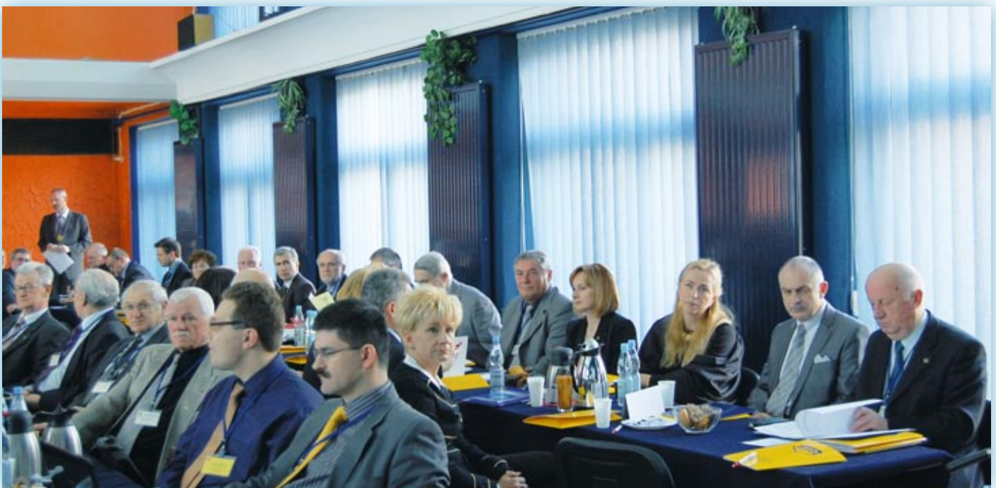
Obrady IX Zjazdu Sprawozdawczo-Wyborczego LOIIB