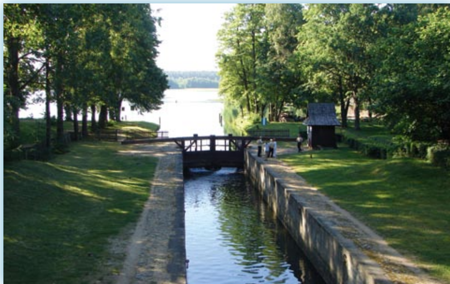
Śluza w Przewięzi

łodzi około 150 tonowych o wymiarach 43,0 x 5,2 m i zanurzeniu około 1,20 m. W oparciu o ówczesne projekty francuskie przyjęto wymiary śluz komorowych długości 47,6 m i szerokości 6,4 m. Prądzyński zaprojektował 11 śluz. Podczas prowadzenia robót projekt był korygowany i zbudowano 18 śluz. Śluzy o spadkach w granicach 0,8-8,0 m były murowane z kamienia polnego, licowane cegłą na zaprawie z wapna hydraulicznego. Elementy ścian komory i głów narażone na uszkodzenia, jak np. przyczółki, wnęki wrót, progi i górne krawędzie komory śluzy, zostały oblicowane ciosami z piaskowca. Ściany