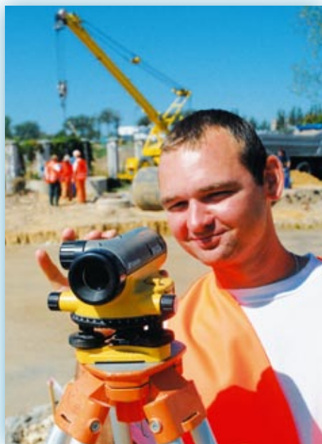
Usługa transgraniczna powinna być wykonywana przejściowo i musi być czasowo ograniczona