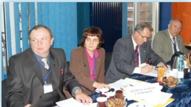
Komisja Uchwał i Wniośków