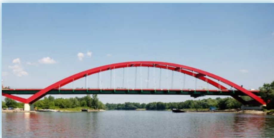
Nowy most przez Wisłę w Puławach to budowla o wysokich walorach estetycznych

snym projektowaniu technologia budowy jest jednym z ważnych czynników, ale już nie najważniejszym. Technologię bowiem powinno się dobierać do różnych form konstrukcji i ją doskonalić, w połączeniu z czynnikami mającymi przede wszystkim wpływ na trwałość, a co za tym idzie - niezawodność eksploatacyjną, a tym samym niskie koszty utrzymania. Pod żadnym pozorem nie należy pomijać czynników, które mają wpływ na estetykę obiektu