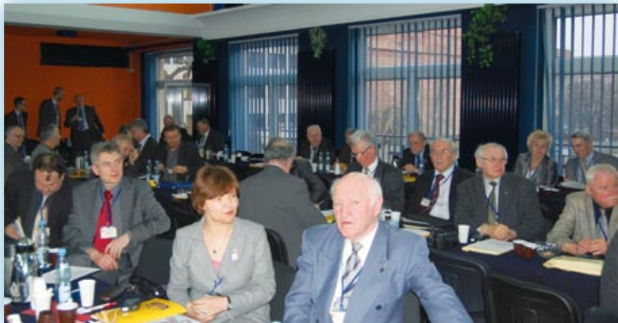
Sala obrad IX Zjazdu LOIB