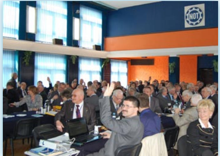
Głosowanie podczas obrad zjazdowych

Delegaci uczestniczący w IX Zjeździe Sprawozdawczo-Wyborczym LOIIB przyjęli 9 wniosków. Zostały one pogrupowane