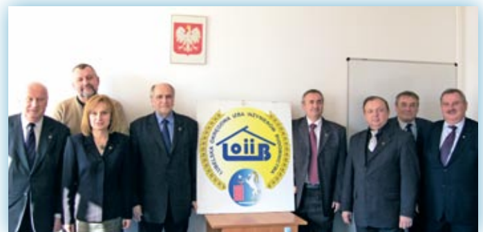
Prezydium Okręgowej Rady LOIIB