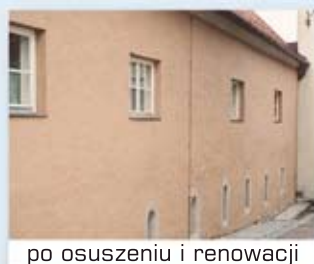
po osuszeniu i renowacji

OSUSZAMY MURY WEWNĘTRZNE I ZEWNĘTRZNE JEDNOCZEŚNIE