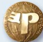
Złoty Medal Targów Poznańskich BUDMA