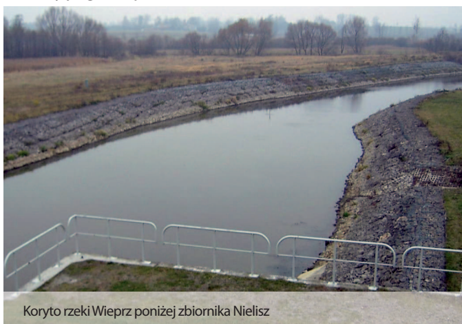
Koryto rzeki Wieprz poniżej zbiornika Nielisz

wy trójdzielne płaskie z napędem ręcznym). Ograniczono projektowany zakres pogłębienia i pojemności całkowitej na zbiorniku wstępnym z uwagi na jego przeznaczenie dla celów ekologicznych. W związku z tym pojawiły się rzadkie gatunki ptaków chronione Dyrektywą Unii Europejskiej nr 79/409/EWG (Dyrektywa Ptasia).