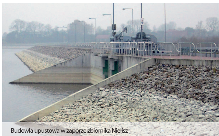
Budowla upustowa w zaporze zbiornika Nielisz

o długościach 360 m i 424 m o wysokości 3,85 m i szerokości korony 9,0 m. W zaprzęgu czołowej zbiornika wstępnego zaprojektowano budowlę upustową (jaz żelbetowy o świetle 2 x 2,5 + 8,0 m z mostem o szerokości 7,0 m) z zamknięciami (zasu-