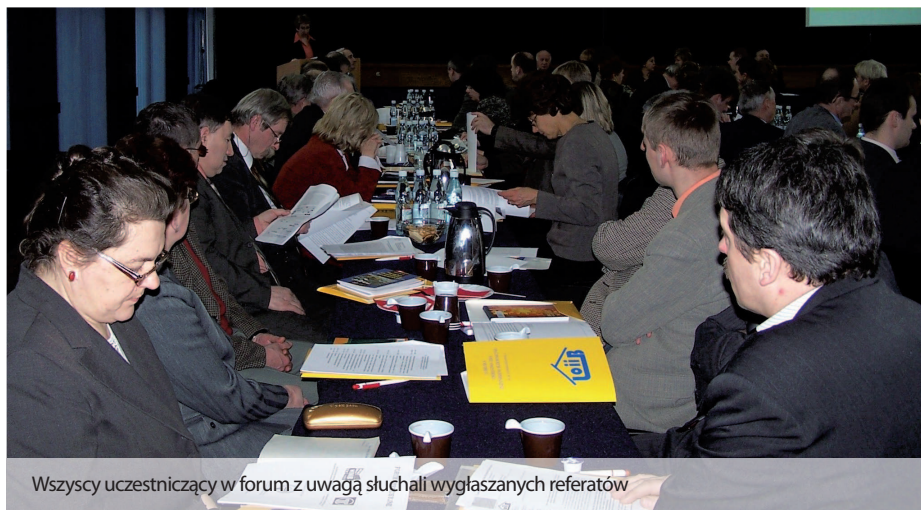
Wszyscy uczestniczący w forum z uwagą słuchali wygłaszanych referatów

Szczególną uwagę poświęcono błędom popełnianym przez osoby sprawujące samodzielne funkcje techniczne podczas procesu budowlanego. Omówiono także program bezpieczeństwa i ochrony zdrowia w czasie prowadzonych robót, przedstawiono projektowane zmiany do ustawy Prawo budowlane, wspomniano o problemach związanych z interpretacją upraw-