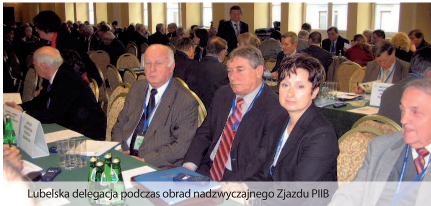
Lubelska delegacja podczas obrad nadzwyczajnego Zjazdu PIIB

W drugiej części obrad, prof. Zbigniew Grabowski wygłosił referat problemowy na temat dotychczasowych dokonań PIIB i zadań na lata 2007-2010. Ta część Zjazdu została także wyraźnie zdominowana przez problemy organizacyjne i prawno-regulaminowe dotyczące PIIB. Dość dużo czasu poświęcono „Kodeksowi zasad etyki zawodowej członków PIIB”, który wreszcie po kilku latach szerokiej konsultacji, modyfikacji i zmianach treści został uchwalony. Jest to bardzo duże wydarzenie, gdyż uchwalony „Kodeks” jest ważnym dokumentem nie tylko dla statutowych organów PIIB, ale również dla wszystkich szeregowych członków.